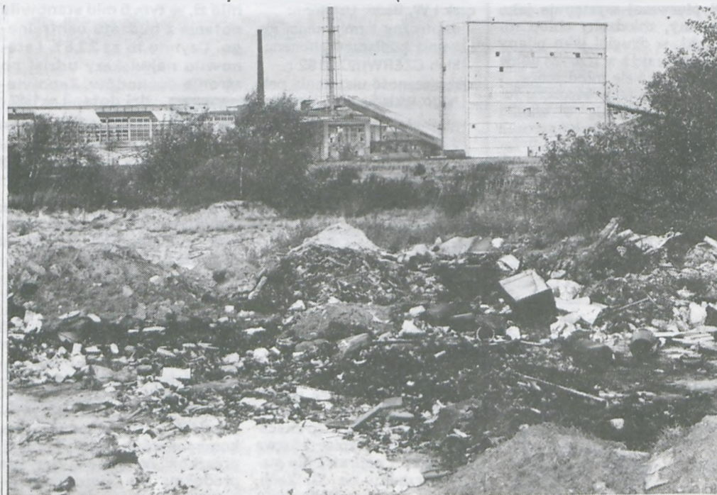
Kto posprząta bałagan za „fosforami” ?

Pogotowie wyjeżdżało do 32 wypadków. Zachorowań notowano 287 oprócz tego chorowało 95 dzieci. Porad ambulatoryjnych udzielono 73 razy. Dane uzyskaliśmy za okres od 31. 01 do 29. 02.