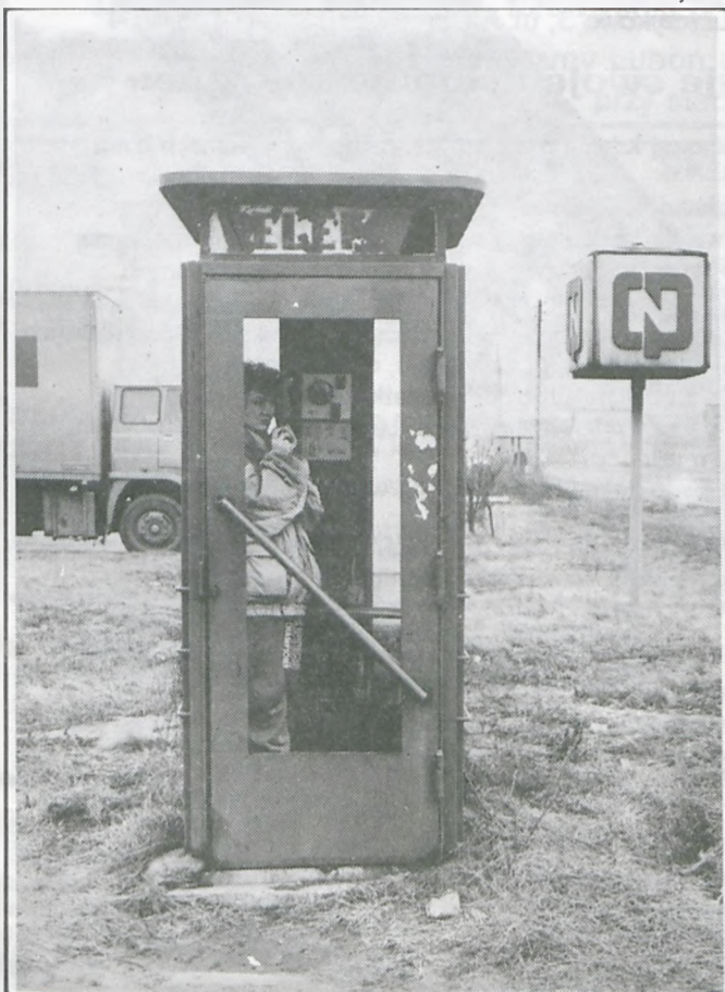
Mieszkańcy z rejonu ulic Fabrycznej i Sobieskiego narzekają, że z budki telefonicznej przy CPN można telefonować tylko w obrębie Lubonia. Dlaczego tak jest? pytamy Urząd Telekomunikacji.

Zainteresowanych pracą Komitetu zapraszamy do redakcji, gdzie list dostępny jest w całości.