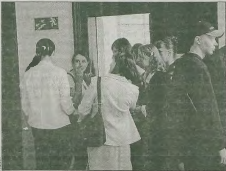
ZSZ nr 2. Za chwilę wejdą na egzamin ustny.

711 osób przystąpiło w tym roku do pisemnej matury w powiecie krotoszyńskim. Nikt nie oblał części pisemnej w LO im. H. Kołątaja. Z najgorszym skutkiem zdawano w tym roku matematykę.