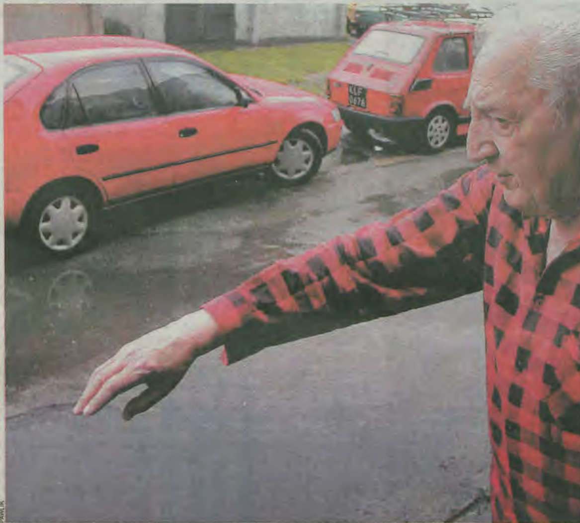
„Woda nie ma gdzie spływać, proszę zobaczyć!” — mówi mieszkaniec ulicy Kaszarskiej w Krotoszynie