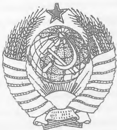
Godło Związku Radzieckiego