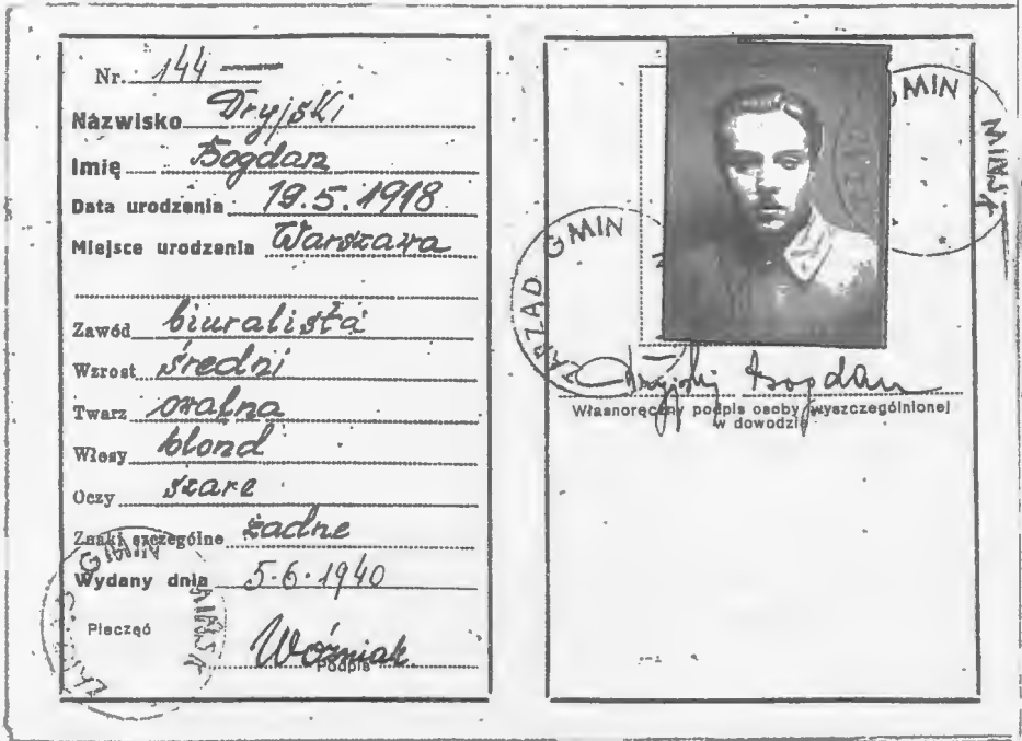
Środkowa strona dowodu osobistego Ser.A.Nr 144 wydanego przez Gminę Mińsk, pow.Mińsk, woj.warszawskie.