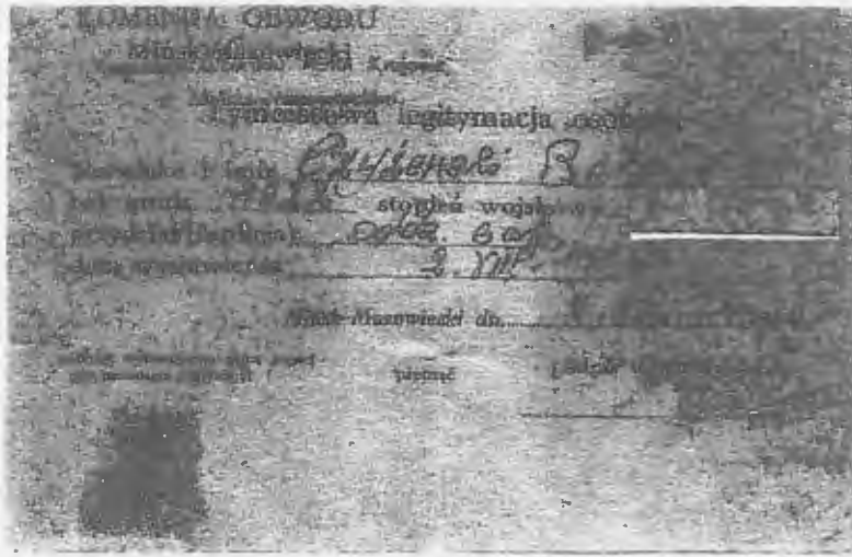
Legitymacja przynależności do Obwodu Armii Krajowej w Mińsku Mazowieckim, wydane w dzień po wybuchu Powstanie Warszawskiego w dniu 1 sierpnia 1944 roku.