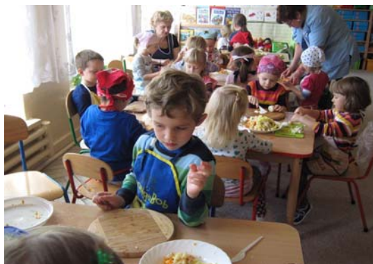
Salatka warzywna w "Misiach"