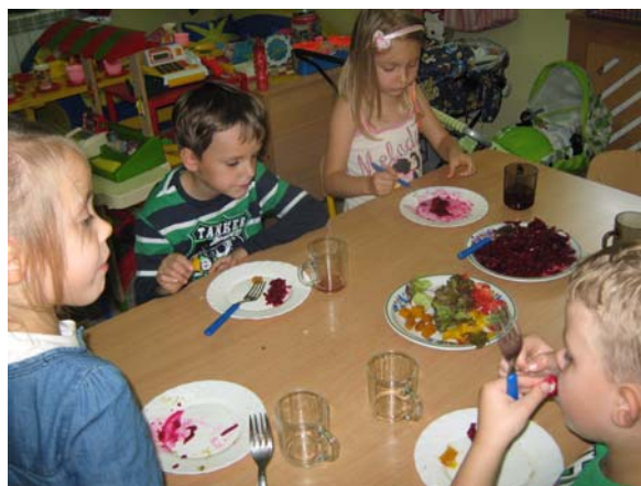
Degustacja warzyw w