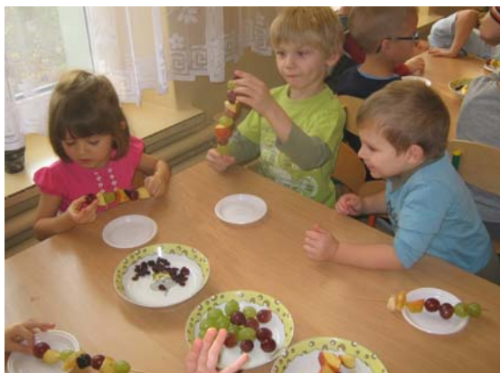
Szaszłyki owocowe "Żabki" "Motylkach"