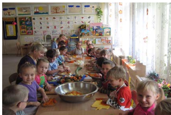
Salatka warzywna w " Muchomorkach"