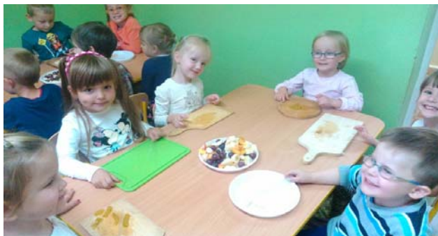
Warsztaty kulinarne na Rawce- filii Przedszkola nr 5