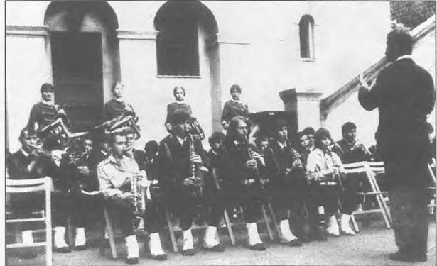
Orkiestra uświetnia większość uniejowskich uroczystości