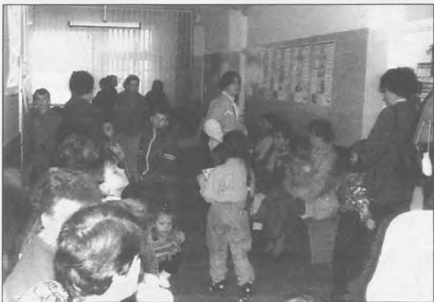
Wtorek 12 listopada w przychodni

Każdy z lekarzy pediatrów ma w swoim rejonie 2000 dzieci, przy takim natężeniu nie są w stanie wszystkich przyjąć. Dzieci nie pozostawia się jednak bez bezpłatnej pomocy medycznej. Po godzinie 15.00 przyjmuje lekarz pediatra w pogotowiu. (art)