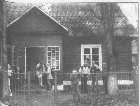
Goście z Jokiszek przed szkołą oczekiwały na przyjaciół z Polski