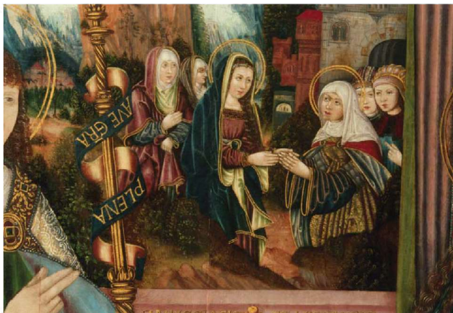
8. Nawiedzenie, fragm. obrazu Zwiastowanie NMP , il. 1.