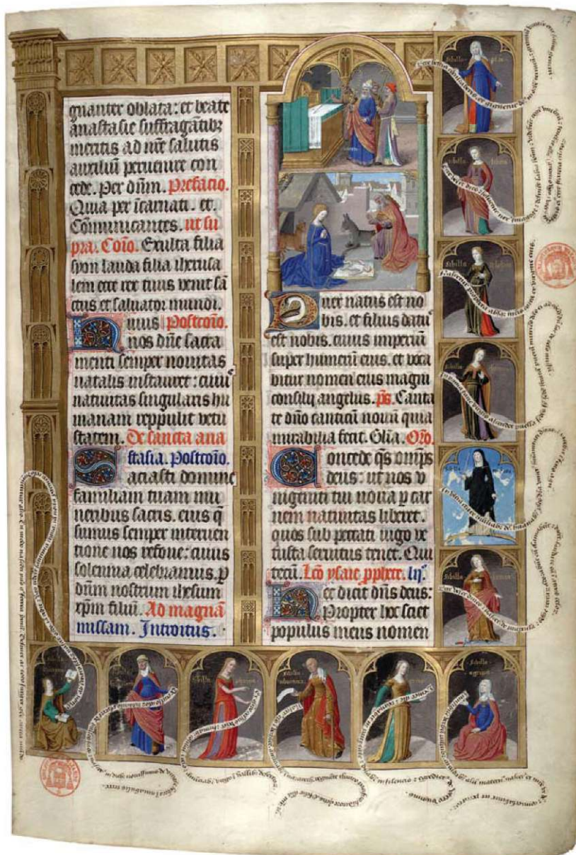
13. Narodzenie Chrystusa i sybille, Mszał na użytek Paryża, 1492 r. Paryż, Bibliothèque Mazarine, ms. 412, fol. 17.