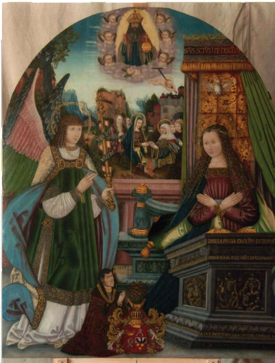
1. Malarz nieznan, Zwiastowanie NMP , kwadra środkowa dawnego tryptyku, 1529 r. Zamek w Kórniku