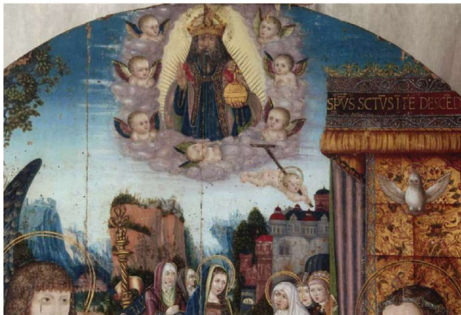
6. Bóg Ojciec i Logos-Dzieciątko Jezus, fragm. obrazu Zwiastowanie NMP , il. 1.