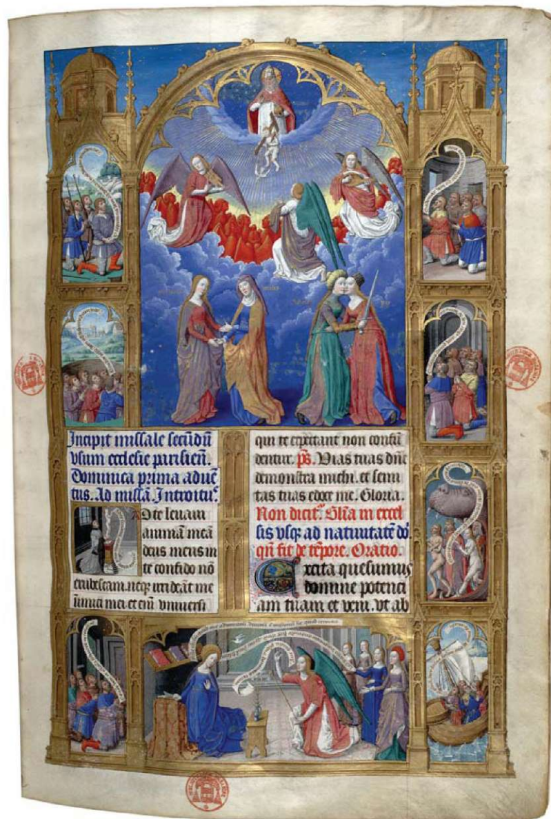
12. Karta z przedstawieniem Trójcy Świętej, Cnot i Zwiastowaniem. Mszał na użytek Paryża, 1492 r. Paryż, Bibliothèque Mazarine, ms. 412, fol. 1.