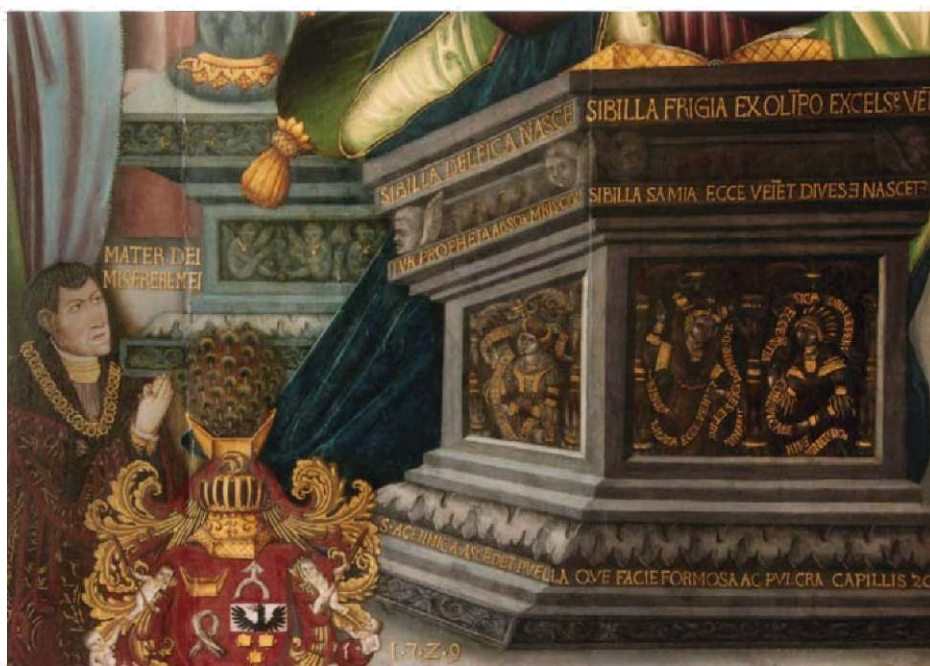
7. Pulpit z przedstawieniami sybilli i napisami ich proroctw, fragm. obrazu Zwiastowanie NMP , il. 1.