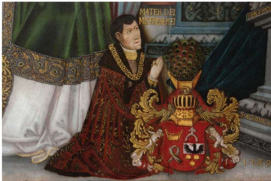
5. Łukasz Górka, fragm. obrazu Zwiastowanie NMP , il. 1.