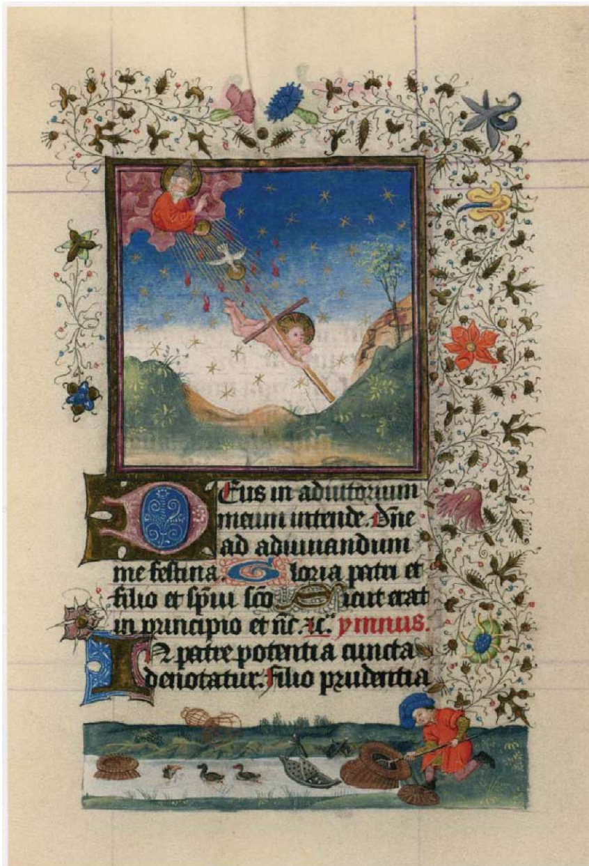
14. „Godzinki” Katarzyny z Kleve, Bóg Ojciec i Logos-Dzieciątko Jezus , ok. 1440 r., fol. 85r. Nowy Jork, The Morgan Library & Museum, M. 945.

Wg Das Stundenbuch der Katharina von Kleve [katalog wystawy w Museum Het Valkhof, Nijmegen 2009/2010 i w Morgan Library & Museum, Nowy Jork, 2010], Stuttgart 2009, tabl. 8