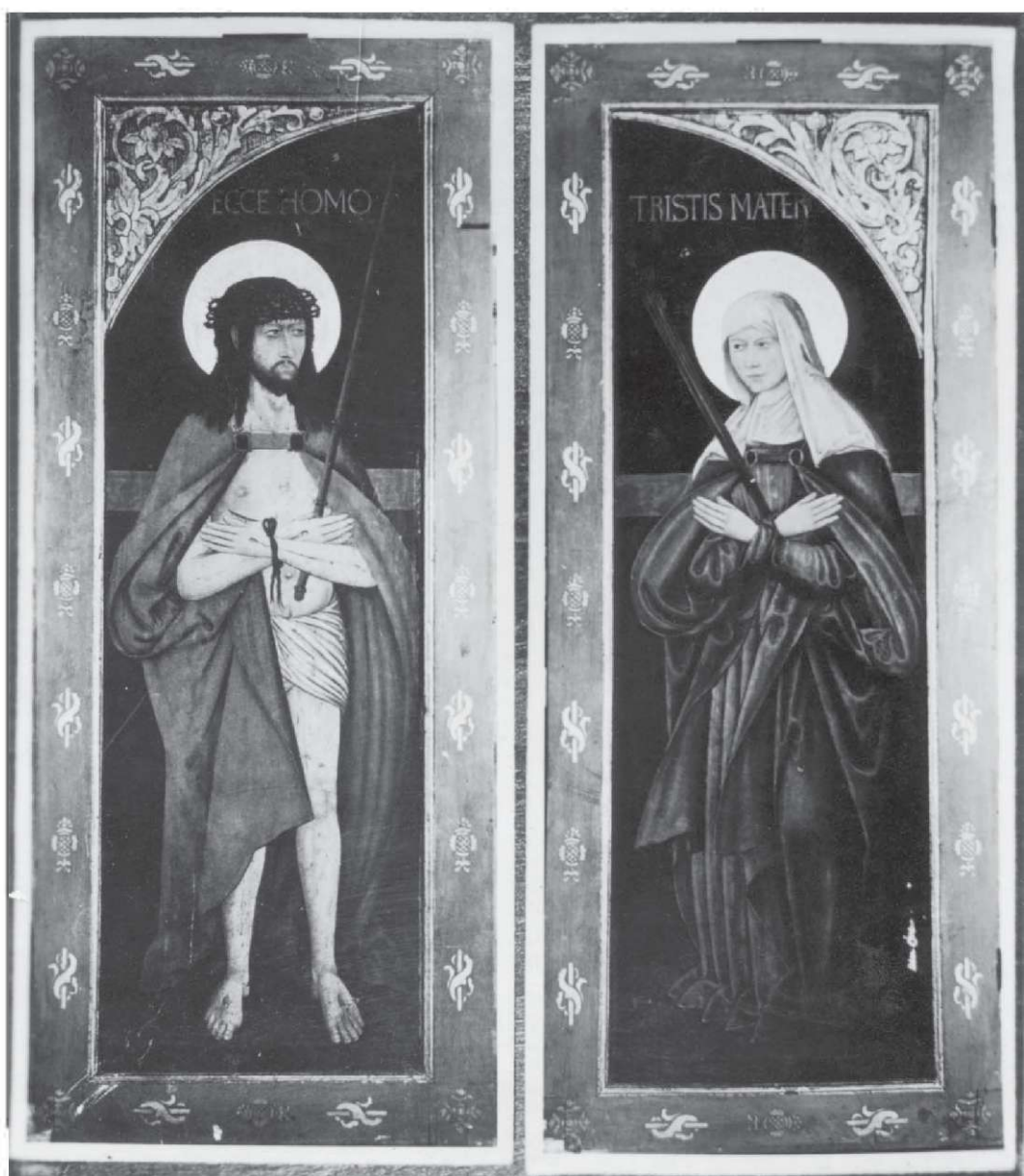
4. Malarz nieznany, Chrystus Bolesny i Matka Boska Bolesna , rewersy skrzydeł dawnego tryptyku, 1529 r. Dawniej Mądre, kościół św. Jadwigi.