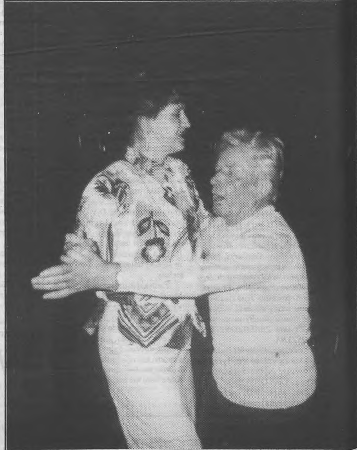
Działkowicze się bawili