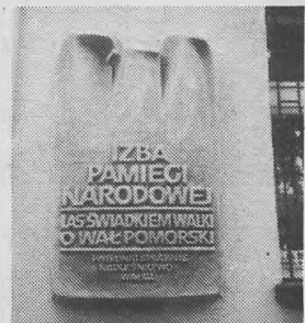
Izba Pamięci Narodowej w Zdbicach