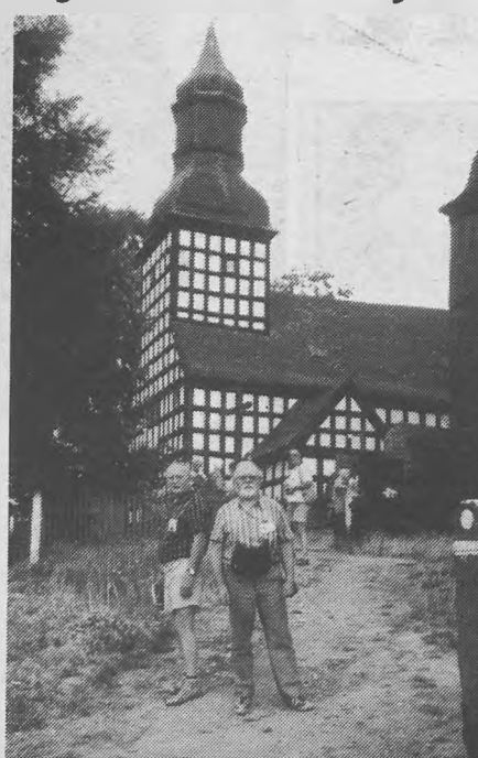
Autor przed kościołem Św. Trójcy w Wielkim Buczku

Przygnębiające było zwiędzenie cmentarzy wojennych w Złotowie i Walczu. Złotowe autokary dojechały też do wsi Podgaje, o którą 1 Dywizja im. T. Kościuszki stoczyła jedną z najcięższych bitew. W czasie walk Niemcy wzięli do niewoli i następnie spalili żywcem trzydziestu wau żołnierzy polskich. Dziś w miejscich bohaterkiej