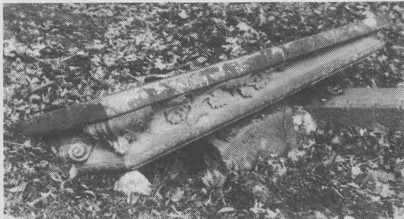
Fot. arch. Cmentarz Ewangelicki

Trzydziestotysięczny Krotoszyn ma wszelkie dane ku temu, by być miastem pięknym i zadbanym. Z roku na rok poprawia się estetyka otoczenia naszych domów i ulic. Przybývá zieleni, nowych elewacji czy wyremontowanych chodników. Jednakże obok tych urokliwych zakątków miasta kryją się jeszcze i takie miejsca, o których ze wstydu staramy się nie pamiętać.