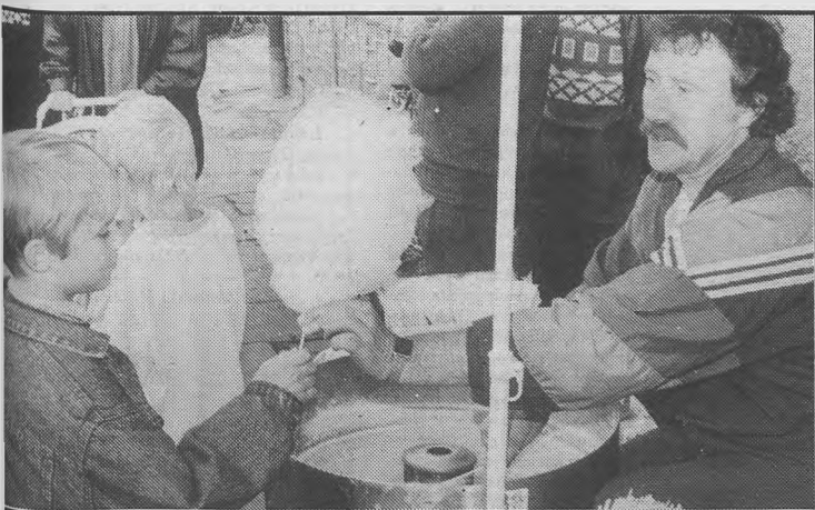
Najstarszy mieszkaniec Zdun