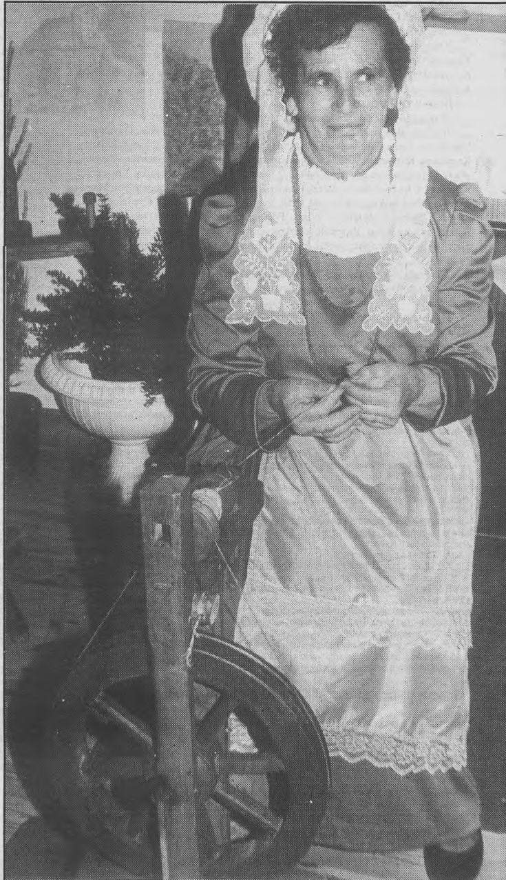
Ten kołowrotek służy rodzinie od dziesięcioleci

Dużym zainteresowaniem zwiedzających cieszyły się: wystawa produktów miejscowych firm w ratuszu oraz kwiatów i warzyw wyhodowanych przez panie z Koła Gospodyń (ta druga w ratuszo-