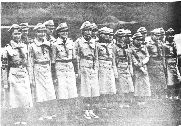
Drużyna im. Władysława Sikorskiego z Uniejowa, była w latach 80-tych drużyną sztandarową ZHP i w nagrodę wyjechała na obóz do Mongolii