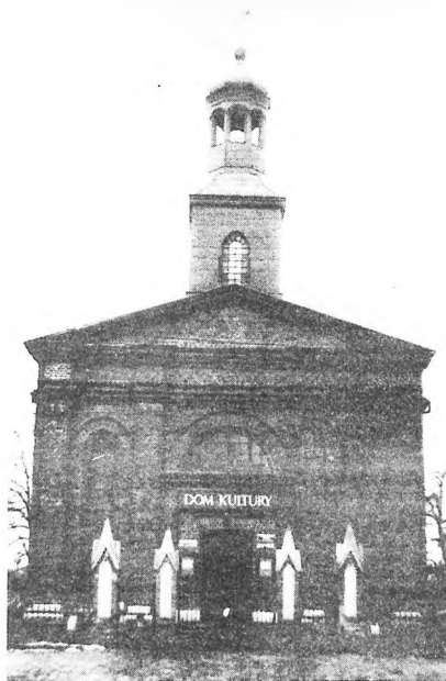
Dom Kultury we Władysławowie