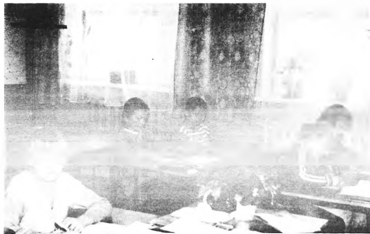
Lekcja j. polskiego w klasie pierwszej