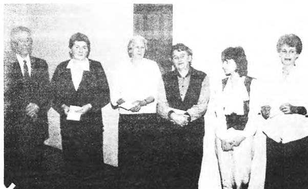
Laureaci konkursu „Poprawiamy estetykę naszych wsi”

Ostatnią w 1994 roku sesję Rady Gminy w Przykonia poświęcono uchwaleniu podatków i opłat na następny rok.