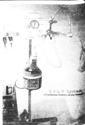
Tak wygląda jeden z aparatów, który otrzymał nasz szpital

Mamy nadzieję, że tym wszystkim, którzy w ostatnią niedzielę marzli przy zbiórce darów, po przeczytaniu tej informacji zrobi się trochę cieplej.