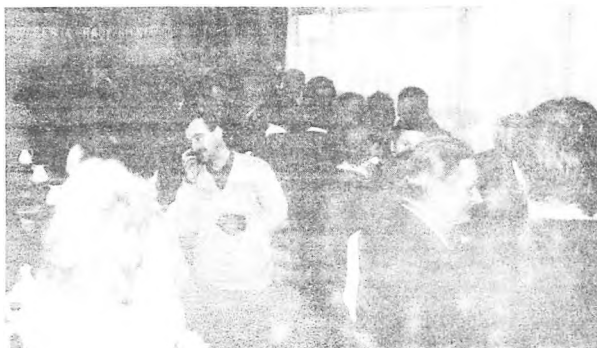
Radni i zaproszeni goście, dali się upiekaniem...