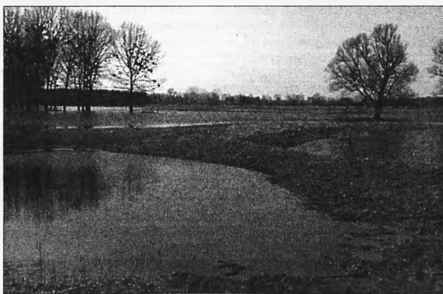
Przedkilkoma tygodniami Warta wylała w okolicach Nowego Miasta. Rozlewiska utrzymują się m. in. na polach w Rogusku