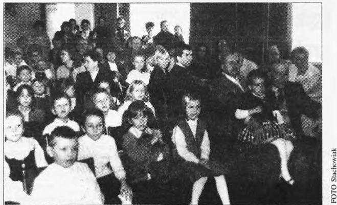
Do sali widowiskowej GOK-u przybyli dziadkowie z wnukami na tradycyjne występy z okazji Dnia Babci i Dziadka