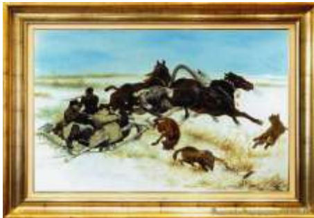
„Napad wilków” Józef Chełmoński

Jednym z ulubionych tematów malarskich są wilki.