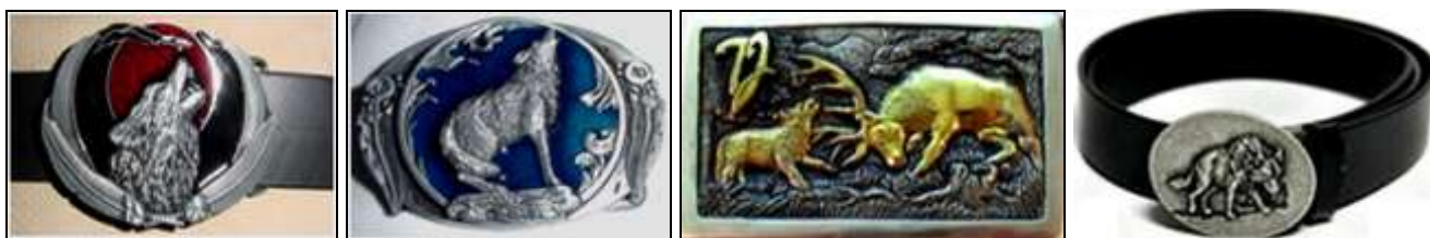
Klamry do pasków