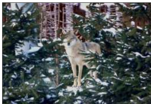
Dolnośląski wilk – fotografię wykonano w 2014 r.

Dzień był słoneczny i mroźny, widok na zaśnieżone Rudawy Janowickie i kopiaste białe pagórki Gór Olbrzymich imponujący. Jastrzębiec zdradził, że pod skalną górą leży jeleni, którego wilki wpędziły na szczyt i zepchnęły