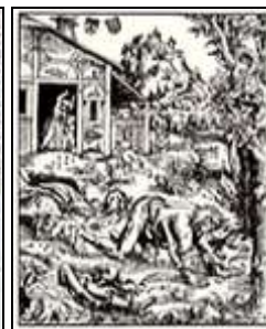
Wilkołak , Lucas Cranach Starszy, 1512 r.