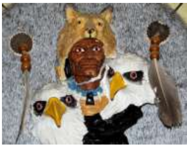
Indianin w przebraniu wilka.

Wilki zimą aktywne są całą dobę, a latem na łowy wyruszają nocą, w dzień śpią. Mają umiejętność śledzenia spojrzenia człowieka i innych stworzeń, ale nigdy nie patrzą człowiekowi w oczy, to sygnał agresji. Pies się tego nauczył w wyniku współżycia z człowiekiem kilka tysięcy lat!