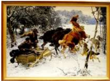
„Napad wilków” Wierusz-Kowalski Alfred