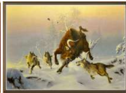
„Tur i wilki” Jerzy Podogrodzki