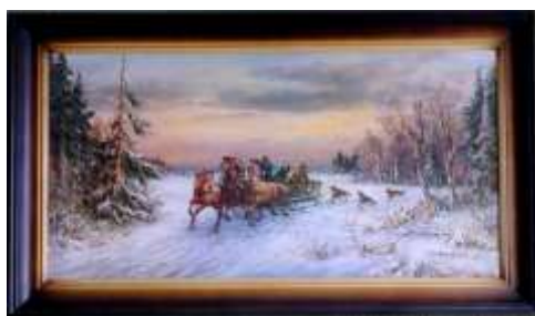
„Napad wilków” autor nieznany