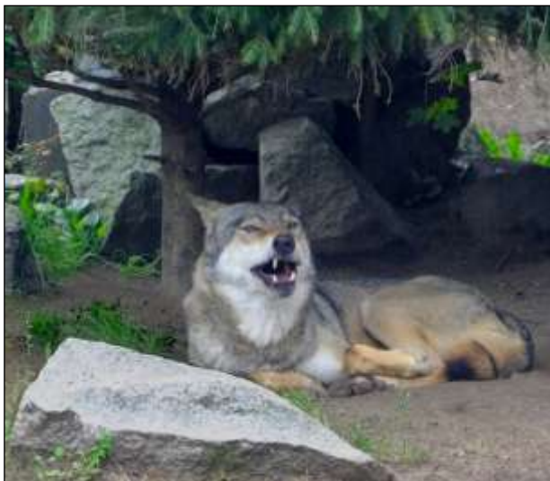
Wilki są objęte ścisłą ochroną.

nych prowadzonych przez koła łowieckie. Głównym pokarmem wilków są jelenie, sarny i dziki, a także polują na zające, lisy, borsuki, bobry, a nawet małe gryzonie. Ataki wilków na zwierzęta hodowlane należą