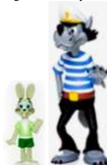
Wilk i zając