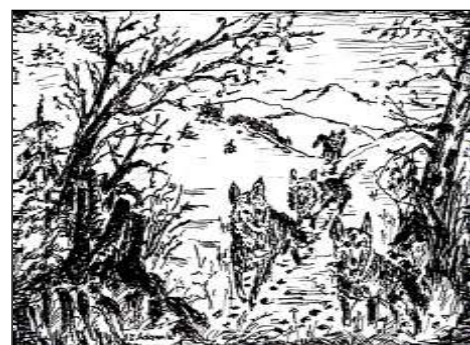
Fragment książki i rysunki autora pt. „Baśń Sudecka o grodzisku Strupicza”, wyd. w 2012 r.

sznurowała wataha wilków. Szły do przynęty na sztych. Dystans nie był odległy. Ziemowit zobaczył wilka, który doganiał pierwszego, a była nim wadera. Basior zatrzymał się koło sosenki, o parę metrów przed zdobyczą. Świsnęła strzała. Basior się zwinął i położył na śniegu. Był to wielki jej uwodziciel i przywódca. Przeżona wadera razem z watahą w popłochu zniknęła w białym lesie. Po dłuższej chwili pod dąb wrócił Jastrzębiec, poszli oboje pod skałę. Ziemowit podniósł i otrzepał ze śniegu wielkiego wilka. Wracali do osady zmarznięci, niewyspani, ale szczęśliwi i zadowoleni z udanej przygody. Ta noc przyniosła im upragnione szczęście.