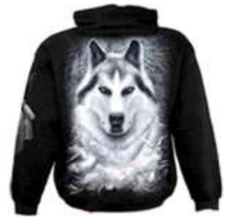
Wizerunek wilka na odzieży