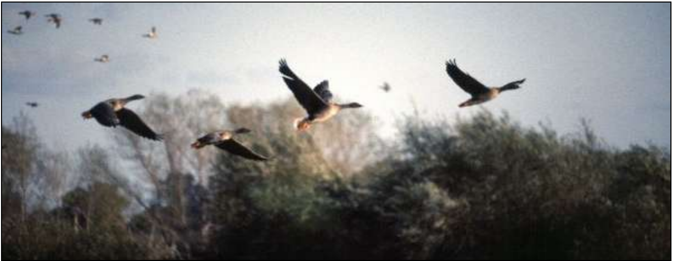
Gęsi lądowały na żwirowni w Wojanowie.