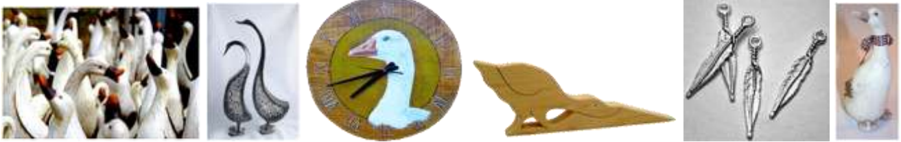
1) Drewniane gęsi; 2) Figurki ażurowe; 3) Zegar z portretem gęsi; 4) Drewniany klin pod drzwi; 5) Zawieszka gęsie pióro; 6) Porcelanowa gęś.