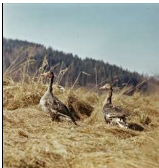
Gęsi wypoczywały pod lasem na Przełęczy Kaczawskiej.