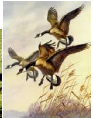
1) Kamienica Pod Złotą Gęsią w Świdnicy; 2) Grzyby gąski; 3 i 4) Bernikle kanadyjskie