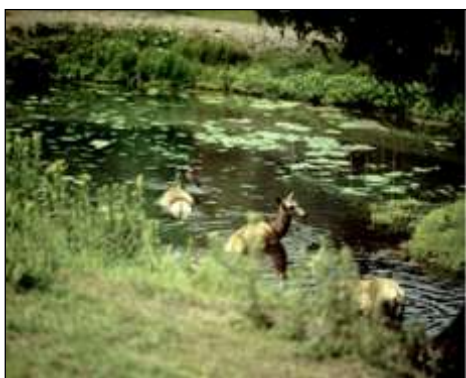
Łanie kąpią się w stawie

fauny, stanowi stałą część krajobrazu i tak jak niegdyś daje o sobie znać w mroźne jesienne wieczory głośnym rykiem i wspaniałymi godami (rykowiskiem), słyszany na turystycznych ścieżkach i pod schroniskami Karkonoszy, Izerów oraz Gór Kaczawskich. W czasie śnieżnej zimy jelenie można spotkać wokół naszego miasta. Według inż. F. Kolba: jelenie, kiedy „budują” wieńce, bardzo chętnie zjadają mchy zwisające z gałęzi starych drzew, gdyż składniki w nich zawarte (fosfor) działają na rozwój ich poroża. Jeżeli mchu brakuje, zmuszone są objadać gałązki młodych drzew świerka, olchy i brzozy. To jednak przynosi wielkie szkody dla gospodarki leśnej. Innym ulubionym żerem jeleni jest jemioła, którą zjadają z zachłannością, a zapach jej nie pozwala odejść z miejsca żerowania. Dlatego też jemioła używana jest jako wabik przy ocenie i podawaniu zwierzynie środków leczniczych.