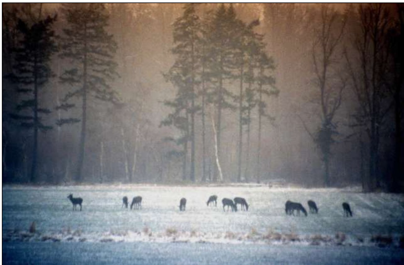
Jelenie ukazały się w nocy jak duchy, chmara zgęstniała w zimnym blasku księżyca

Las stał się moim największym sprzymierzeńcem, w nim cisza i dzika zwierzyna była wielkim pragnieniem i miłością, a przy odrobinie szczęścia zakończona niepowtarzalnym trofeum. Jestem myśliwym, oprócz strzelby zawsze ze sobą noszę aparat fotograficzny i notatnik. Okryty maskującą siatką wybieram wizurki, które przekraczają leśni mieszkańcy. Zastygam w nich na długie godziny w oczekiwaniu na spotkanie i zdobycie tego jedyne trofeum, które może, lecz nie musi się zdarzyć, a może być dobrą fotografią, rysunkiem czy tylko pozostanie strzępem przyrody w moim pamiętniku.