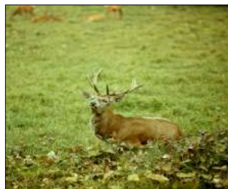
Jeleń na rykowisku