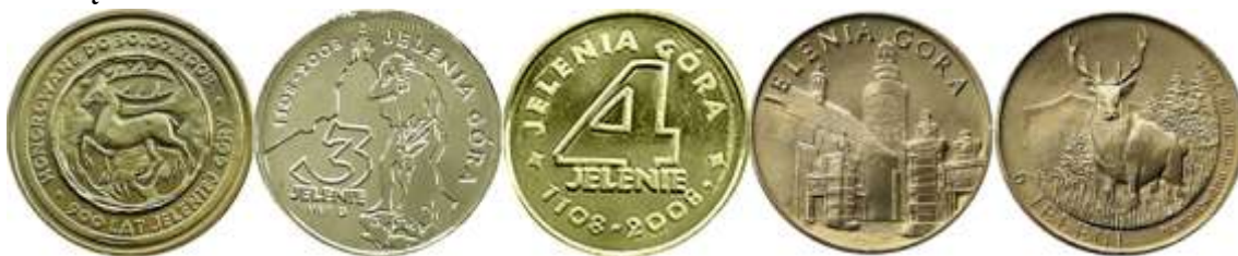
Zdjęcia monet z kolekcji Zofii Wąsik