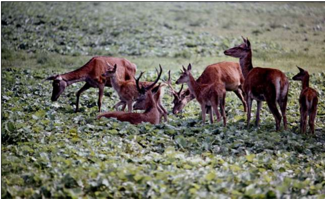
Chmara jeleni na „podkowie”, widziana z ambony wczesnym rankiem w 500 mm obiektywie

migawką i mimo, że odległość była ponad 100 m jelenie w obiektywie były wyraźne. Widocznie jednak wyczuły moją obecność, bo spokojnie, bez szmeru się oddaliły. Fotografie, które wówczas wykonałem pokazał „Łowiec Polski” i podziwiane były na kilku moich wystawach.