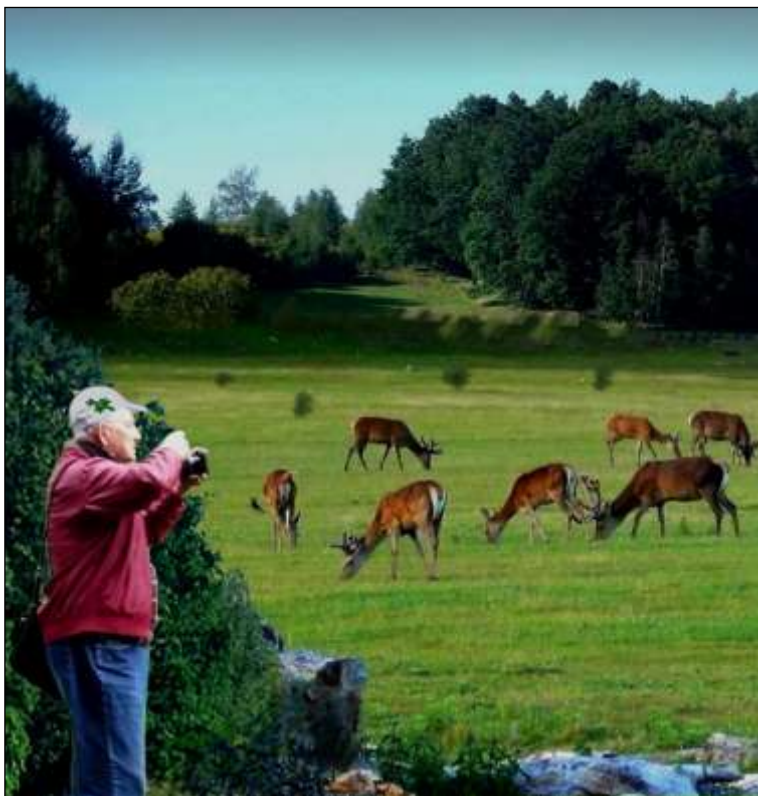
Wczesnym rankiem na łąkach można spotkać jelenie szlachetnej zwierzyny.

W dawnych raportach myśliwskich i kronikach parafialnych czytamy, że pod koniec XVIII w. z Karkonoszy zniknęły dziko żyjące zwierzęta (niedźwiedzie, wilki, rysie itp.) na skutek masowych polowań i odstrzałów. Ocalała jedynie zwierzyna płowa. Dziś jeleni jest największym przedstawicielem naszej