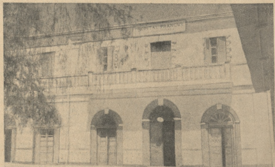
Šzpital francuski w Harrarze, zbombardowany przez lotników włoskich