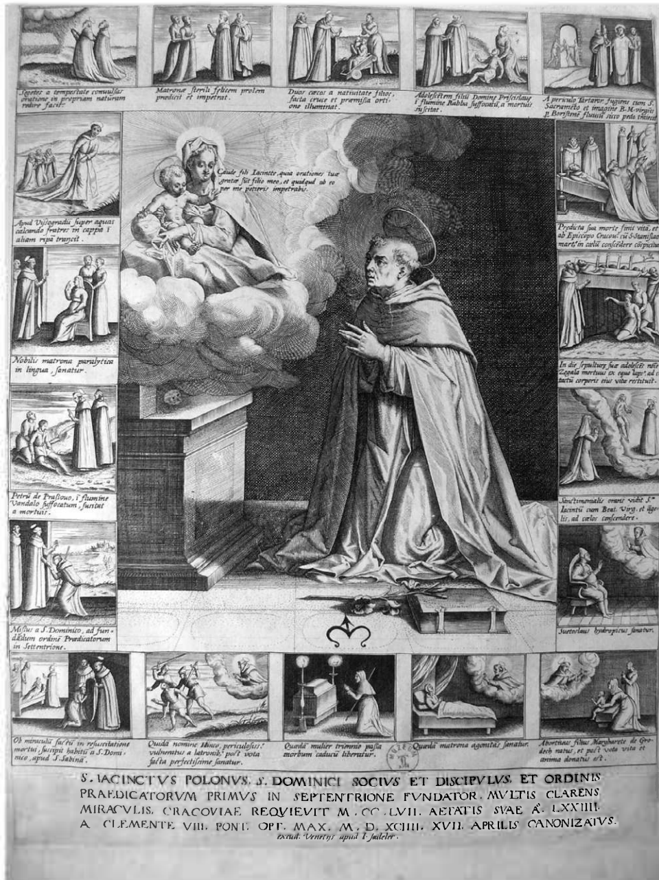
Il. 4. Jan Sadeler, Żywot św. Jacka , miedzioryt. Wenecja, przed 1600. Kraków, Muzeum Czartoryskich