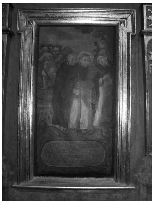
Il. 16. Ucieczka przed Tatarami z Kijowa. Klimontów, kościół poddominikański.