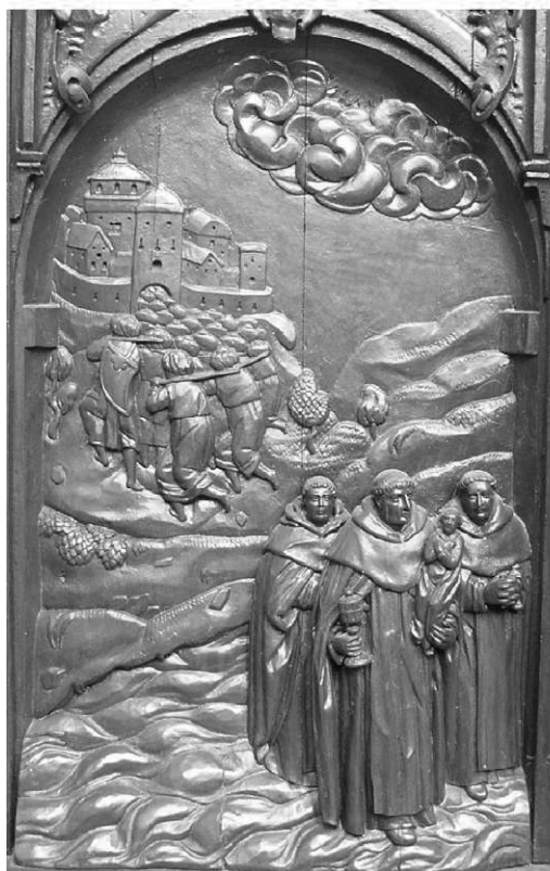
Il. 11. Ucieczka przed Tatarami z Kijowa. Poznań, kościół poddominikański.