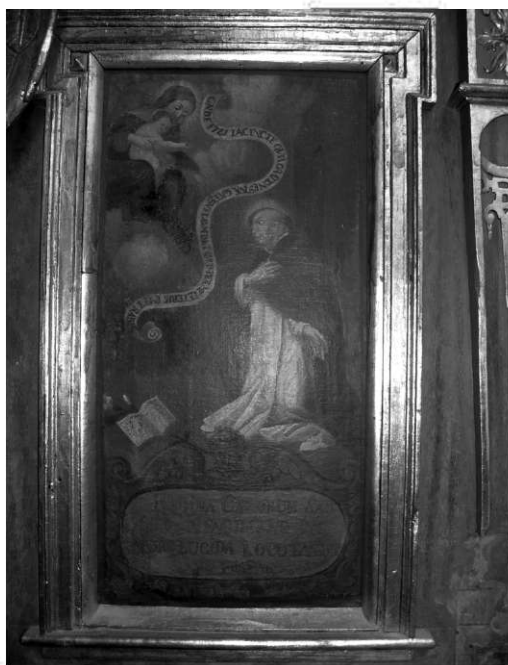
Il. 15. Matka Boska ukazuje się św. Jackowi. Klimontów, kościół poddominikański, ok. 1620-1640.