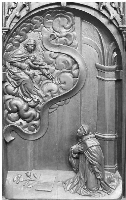
II. 8. Matka Boska ukazuje się św. Jackowi. Poznań, kościół poddominikański.