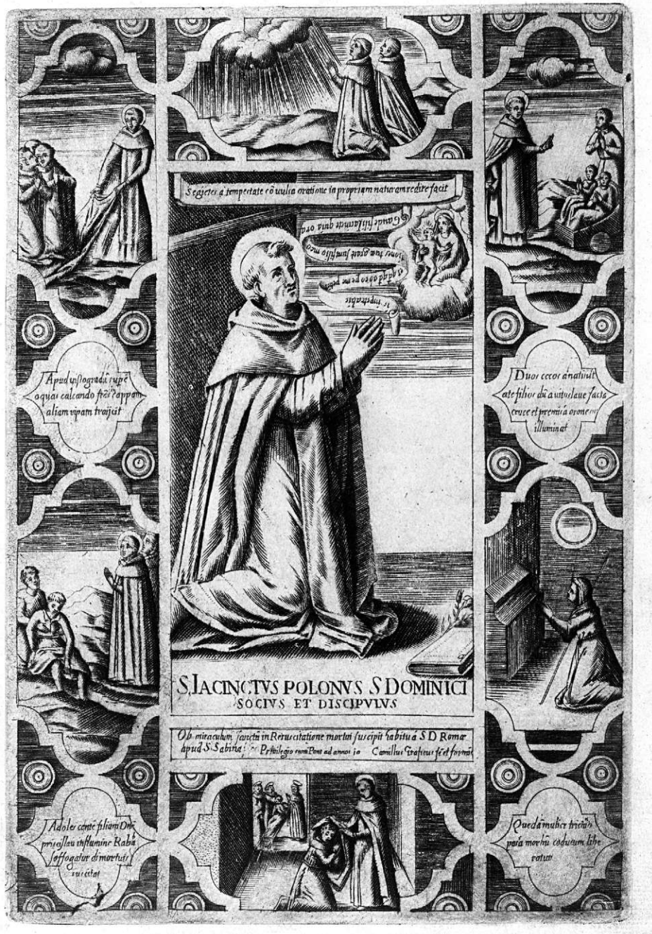
II. 3. Camillo Graffico, Żywot św. Jacka , miedzioryt, Rzym, ok. 1594/1595. Kraków, Muzeum Czartoryskich