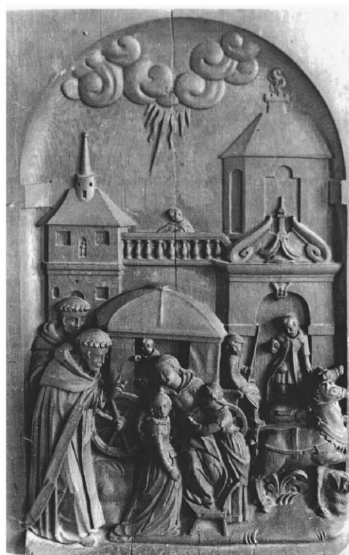
Il. 10. Uzdrowienie sparaliżowanej kobiety. Poznań, kościół podominikański. Obecnie Biblioteka Kórnicka PAN