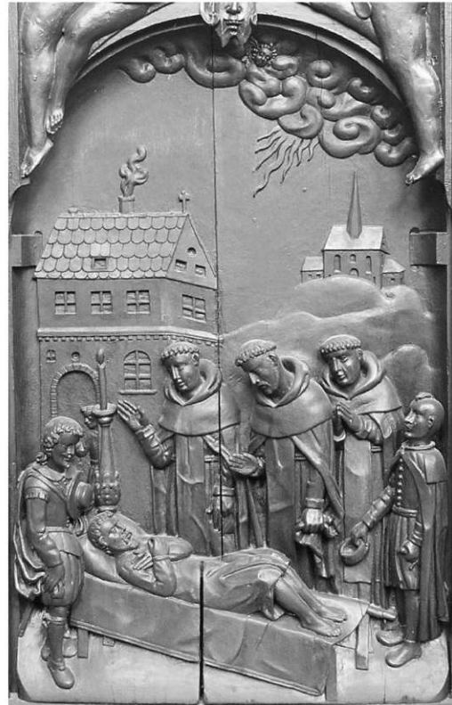
Il. 14. Św. Jacek wskrzesza umarłego. Poznań, kościół poddominikański.