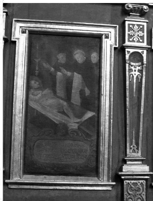
Il. 20. Wskrzeszenie zmarłego. Klimontów, kościół poddominikański.