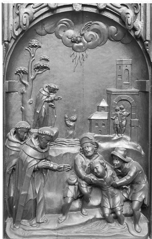
Il. 9. Wskrzeszenie Piotra z Proszowa. Poznań, kościół podominikański.