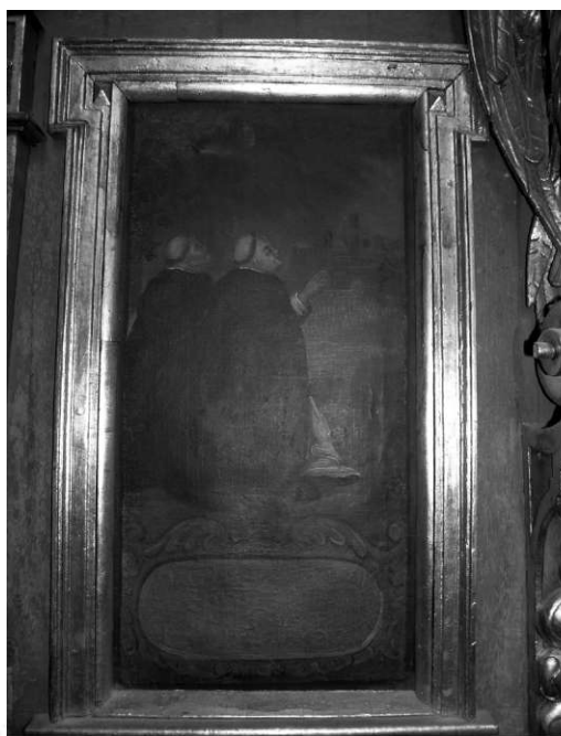
Il. 17. Uratowanie plonów od gradobicia. Klimontów, kościół poddominikański.