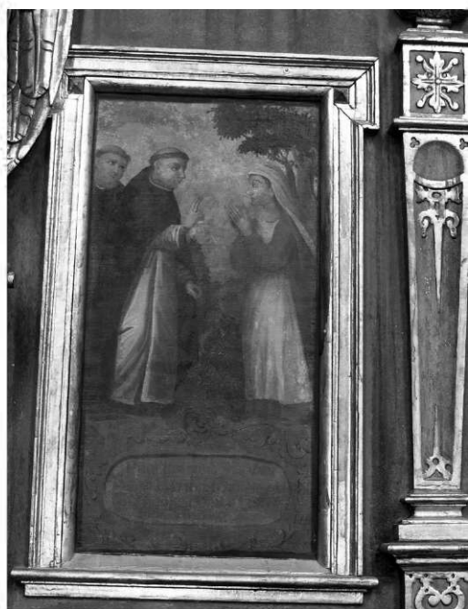
Il. 19. Św. Jacek przepowiada bezpłodnej kobiecie potomstwo. Klimontów, kościół poddominikański.