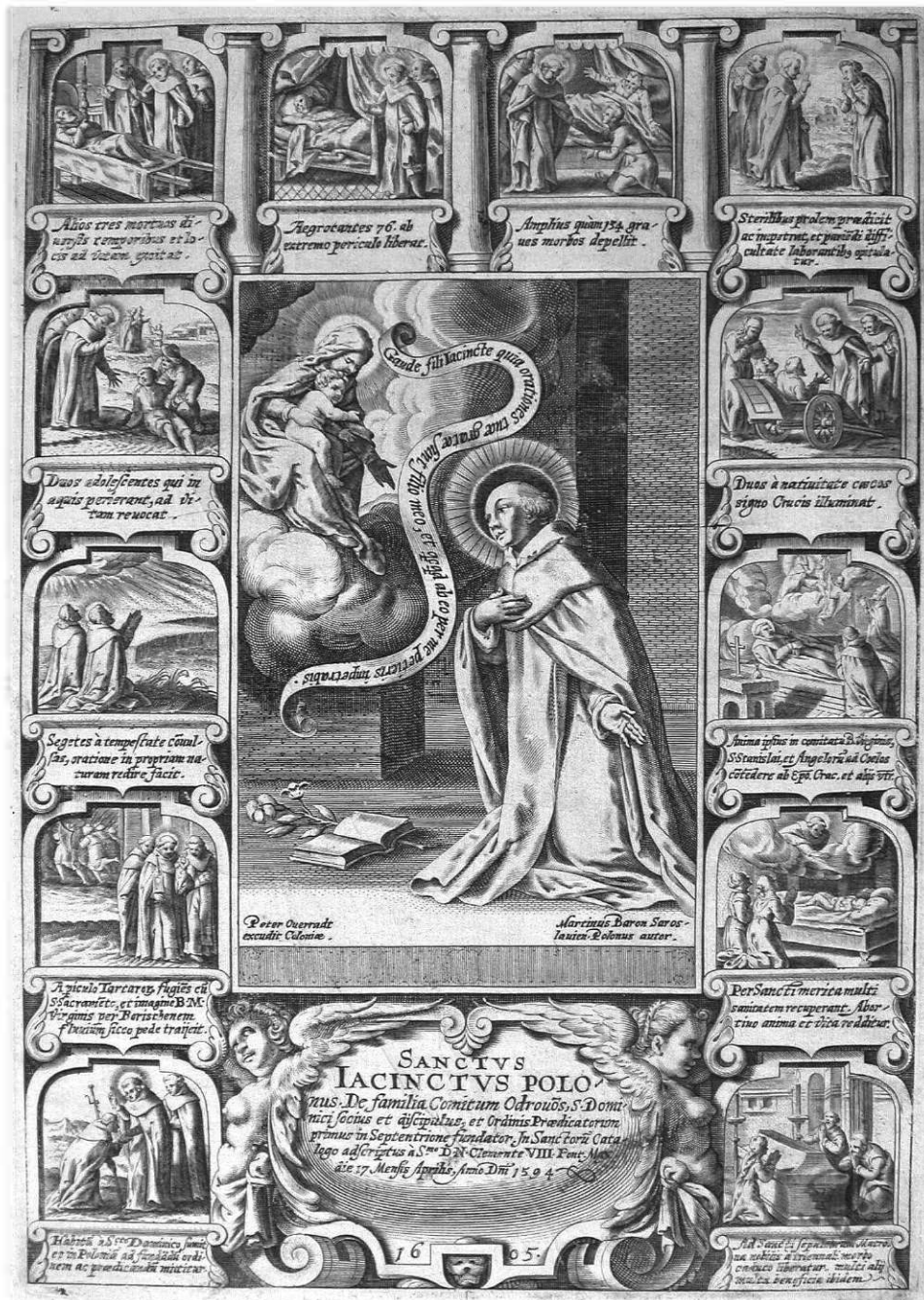
Il. 5. Autor nieznaný, Żywoł św. Jacka , miedzioryt, Peter Overadt (nakł.), Kolonia 1605. Biblioteka Naukowa PAU i PAN w Krakowie