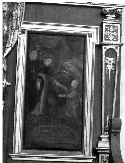
Il. 22. Uzdrowienie chorego. Klimontów, kościół poddominikański.