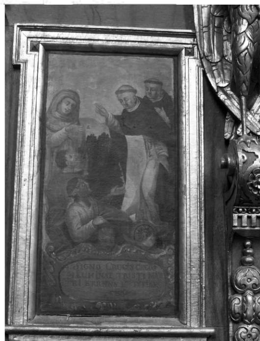
Il. 18. Uzdrowienie niewidomych bliźniąt. Klimontów, kościół poddominikański.