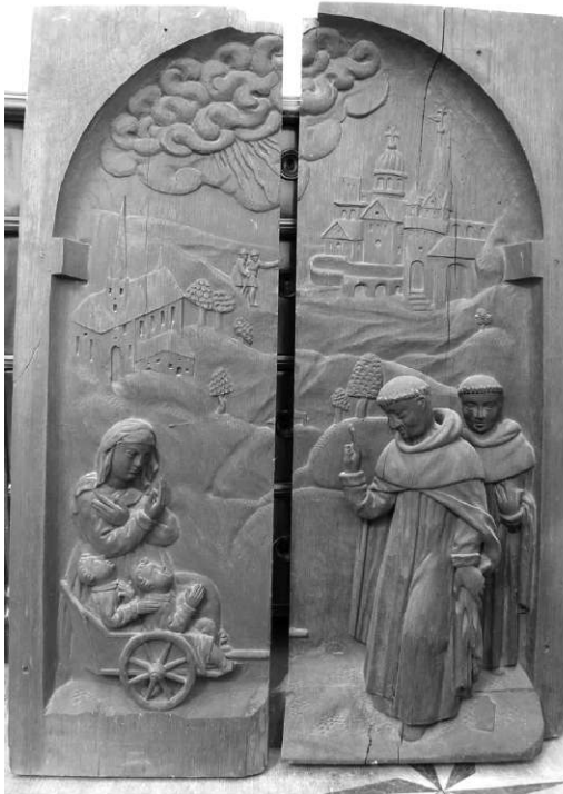
Il. 13. Uzdrowienie niewidomych bliźniąt. Poznań, kościół poddominikański. Obecnie Biblioteka Kórnicka PAN.