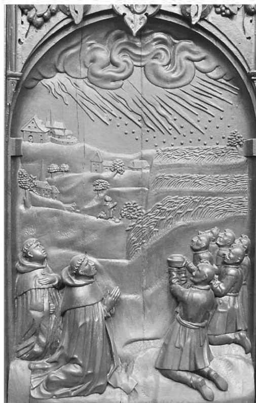
Il. 12. Uratowanie zasiewów od gradobicia. Poznań, kościół poddominikański.