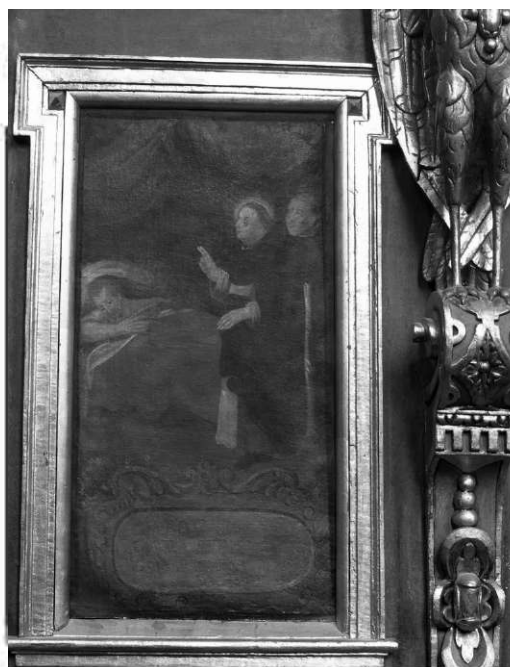
Il. 21. Św. Jacek ratuje konającego. Klimontów, kościół poddominikański.