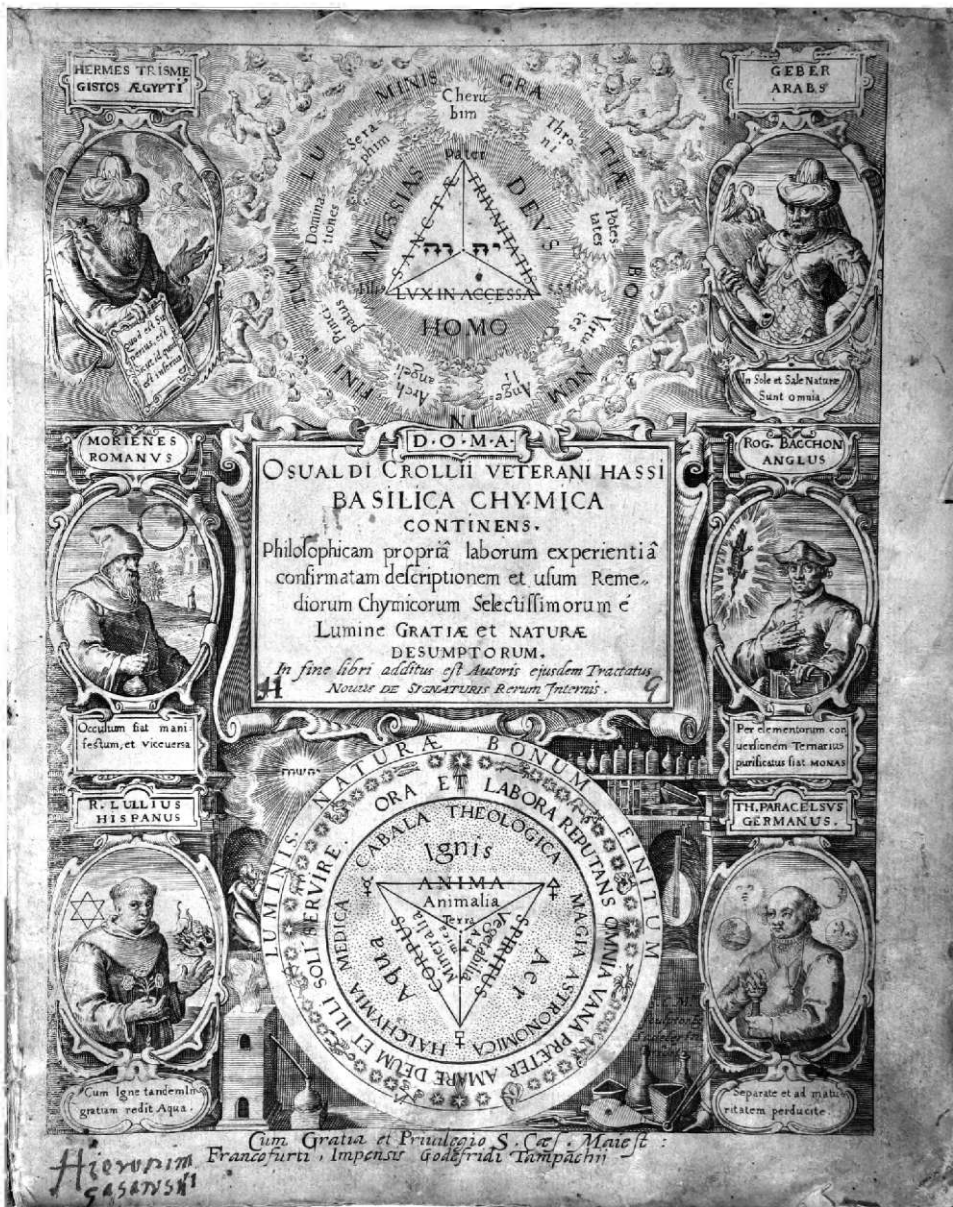
Ryc. 1. Strona tytułowa Basilica chymica Oswalda Crolla rytowana przez Aegidiusa Sadelera do wyd. 1 (1609), wykorzystana w wyd. 2 (nie datowanym, po 1610) z dopiskiem wydawcy Gottfrieda Tampacha u dołu [sygn. BK 29]