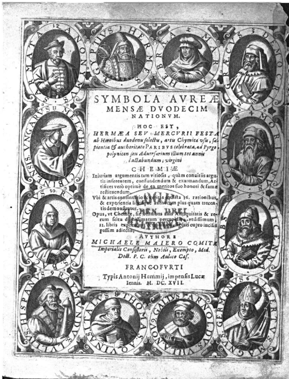
Ryc. 8. Strona tytułowa Symbolae aureae mensae duodecim nationum Michaela Maiera wydanej przez Lucasa Jennisa we Frankfurcie w 1617 r. Medalion w górnym lewym narożniku z numerem 12 i napisem Anonymus Sarmata przedstawia wyidealizowaną podobiznę Michała Sędziwoja [Egzemplarz Biblioteki Uniwersyteckiej w Poznaniu sygn. SD 385.1]