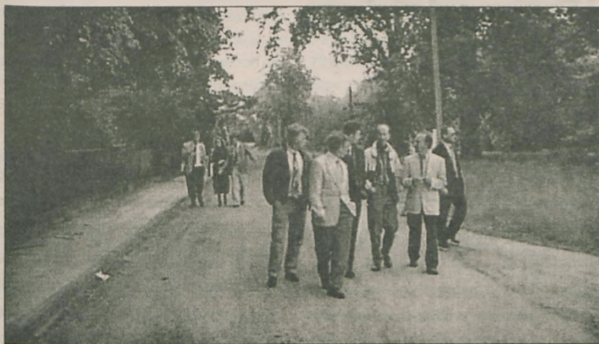
Holenderscy goście zwiedzili teren, na którym wkrótce ma powstać Zakład Aktywności Zawodowej.