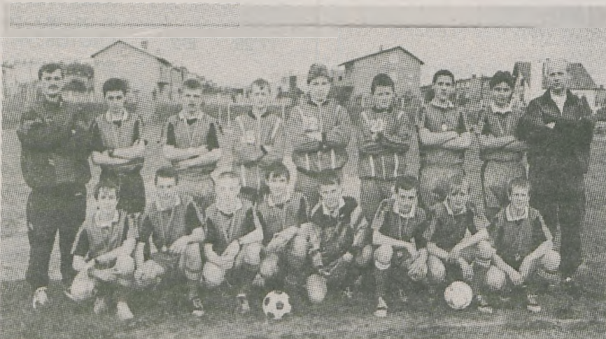
Zwycięska drużyna z Kotlina.