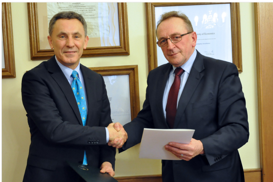
Podpisanie porozumienia o współpracy z Samorządem Województwa Wielkopolskiego

Tradycyjnie już w ostatnią sobotę karnawału, 1 marca 2014 roku, w auli Uczelni odbył się Bal Seledynowy – w tym roku w konwencji balu wiedeńskiego. Jest to wydarzenie o charakterze charytatywnym. W tegorocznej edycji zbiera-