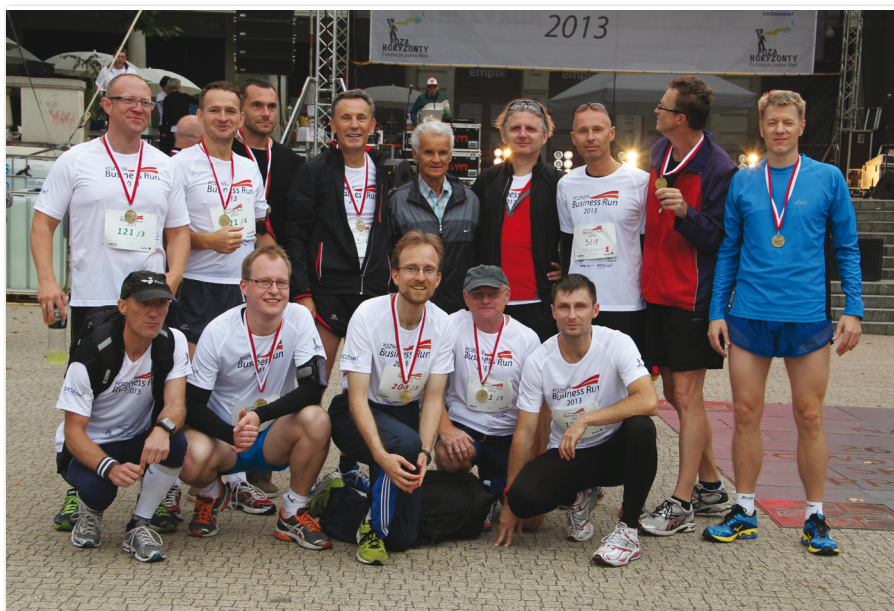
Drużyna UEP w biegu „Poznań Business Run”

Rok akademicki 2013/2014 był szczególny pod względem organizacji zawodów oraz imprez sportowych i rekreacyjnych dla studentów, pracowników i absolwentów UEP. O zaangażowaniu pracowników SWFiS oraz studentów –