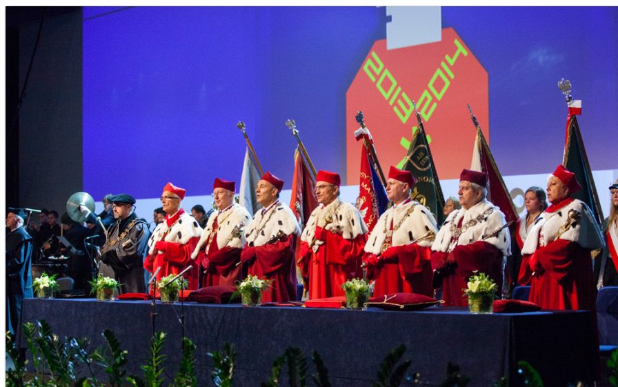
Poznańska Inauguracja Roku Akademickiego 2013/2014