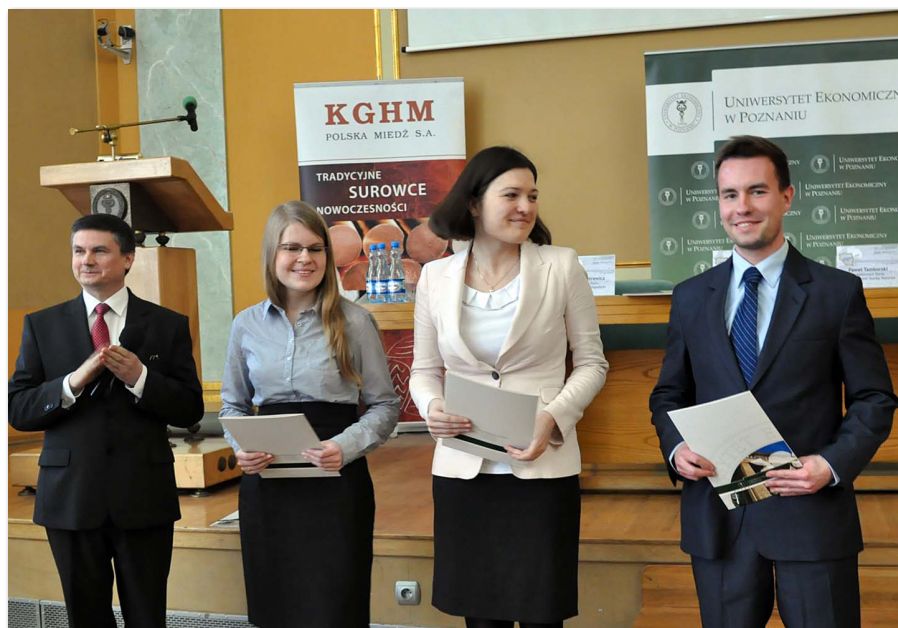
Wręczenie nagród Fundacji UEP laureatom konkursu na najlepsze prace licencjackie