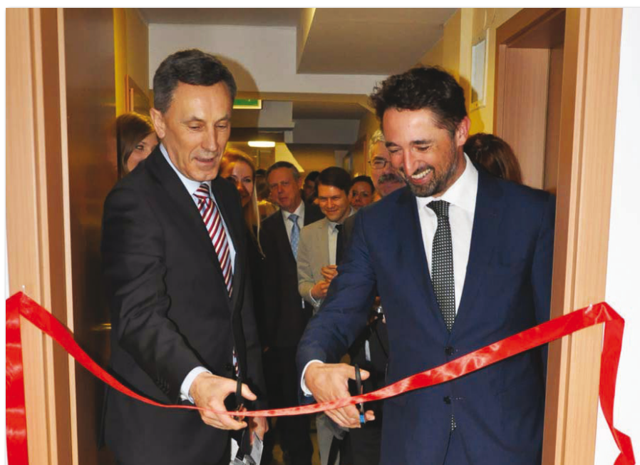
Otwarcie Laboratorium Tradingowego

Dzięki współpracy z praktykami biznesu w minionym roku akademickim wzbogacono ofertę dydaktyczną o nową specjalność. Na Wydziale Zarządzania na kierunku finanse i rachunkowość uruchomiono specjalność operacje finansowe funduszy inwestycyjnych . Kształcenie w tym kierunku odbywa się na studiach stacjonarnych II stopnia. Utworzenie specjalizacji było możliwe poprzez współpracę z firmą Franklin Templeton Investments zajmującą czołowe miejsce, jeśli chodzi o globalny rozwój oraz inwestycje papierów wartościowych i innowacyjne produkty. Przedsiębiorstwo oferuje alternatywne rozwiązania inwestycyjne pod markami Franklin, Templeton oraz Mutual Series w ponad 150 krajach na całym świecie, utrzymując w zarządzaniu aktywa o wartości ponad 815 miliardów dolarów (według stanu na 30 czerwca 2013 roku). W Poznaniu Oddział Franklin Templeton Investments Poland mieści się przy Placu Andersa 3, gdzie odbywają się wybrane zajęcia w ramach nowej specjalności. Studen-