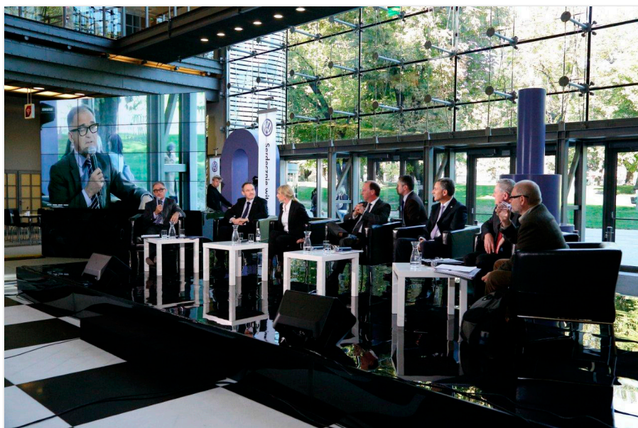
Debata „Ludzie. Przemysł. Miasto. Razem czy osobno?” zorganizowana w ramach obchodów jubileuszu 20-lecia firmy Volkswagen Poznań

W okresie sprawozdawczym Klub Partnera podjął także dodatkowe inicjatywy, takie jak: