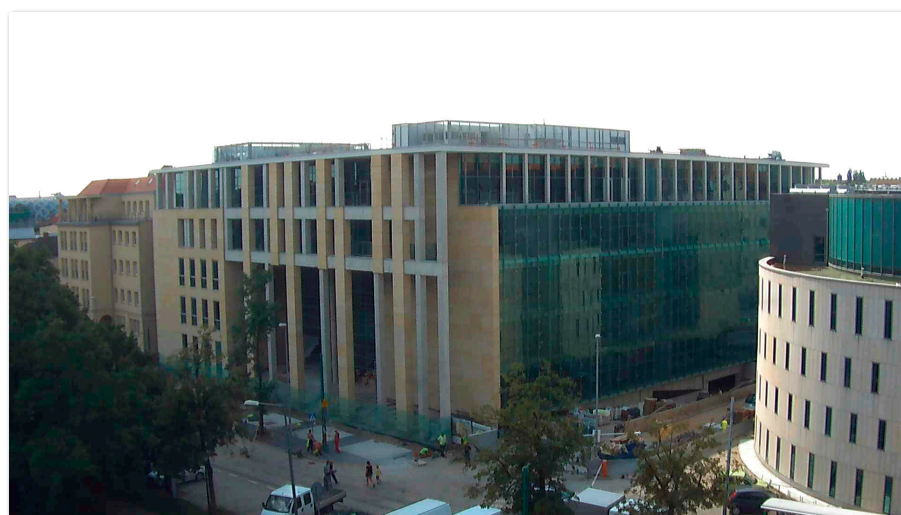
Budowa Centrum Edukacyjnego Usług Elektronicznych przy ul. Towarowej 55

Poza dotacjami z MNiSW na przychody Uczelni z działalności dydaktycznej