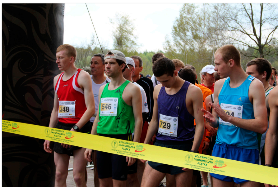
Uczestnicy biegu „Volkswagen Ekonomiczna Piątka”