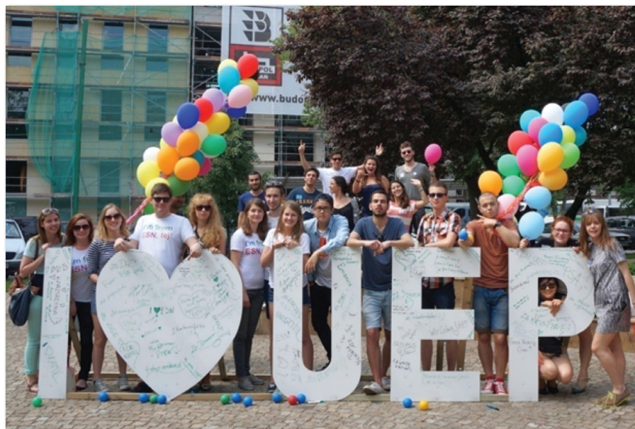
International Day „Taste the World”

Organizacja studencka ESN UE Poznań, która działa na Uniwersytecie Ekonomicznym od października 2007