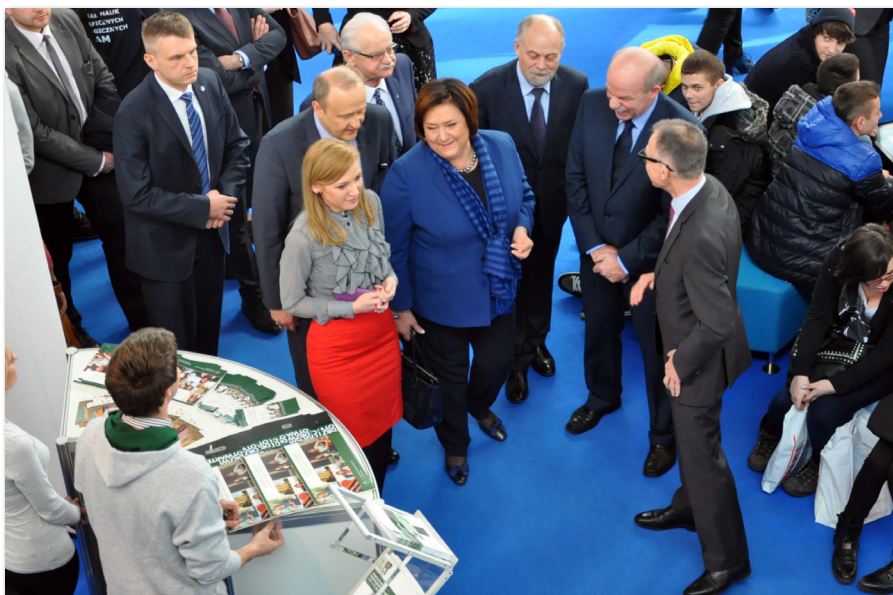
UEP na Targach Edukacyjnych w Poznaniu

Głównym zadaniem Klubu jest przede wszystkim poszerzenie oferty dydaktycznej o zajęcia z praktykami biznesu. W roku akademickim 2013/2014 zorganizowanych zostało 9 takich spotkań: