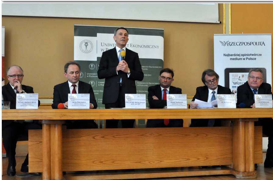
Panel dyskusyjny z udziałem zaproszonych gości podczas VI Dni UEP