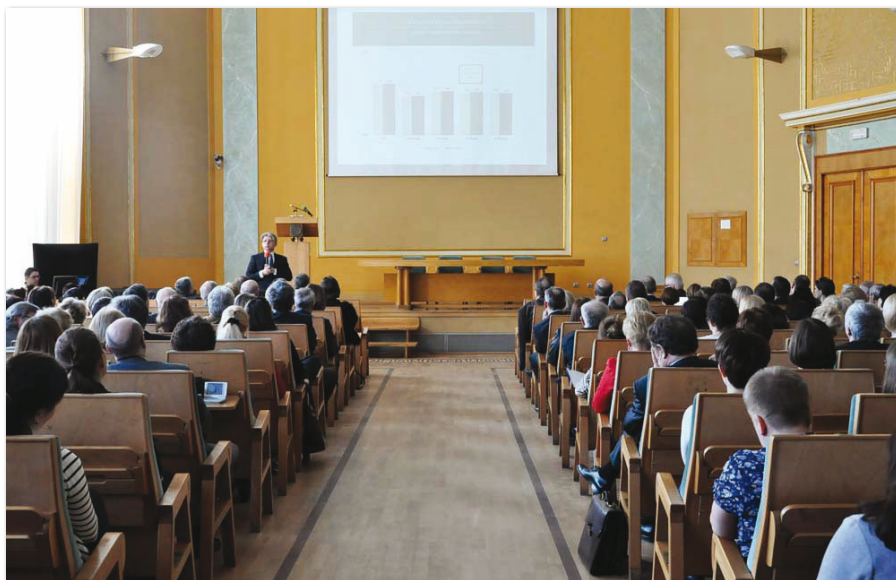
„Spotkanie strategiczne” władz Uczelni z pracownikami

nia Kadr za największe postępy w promocji kadr naukowych. W jubileuszowym 15. rankingu Perspektywy 2014 UEP przesunął się też o trzy pozycje w górę w zestawieniu ogólnym, w którym ocenie poddano 195 polskich uczelni. Wśród uczelni akademickich nasza Uczelnia zajęła wysokie 18. miejsce. Oceniając, brano pod uwagę sześć kategorii kryteriów: prestiż (w tym preferencje pracodawców i uznanie międzynarodowe), innowacyjność (w tym: patenty, zaplecze innowacyjne, pozyskane środki), potencjał naukowy (w tym nasycenie pracownikami o najwyższych kwalifikacjach, uprawnienia do nadawania stopni), efektywność naukową (w tym rozwój kadry, cytowania, publikacje), warunki studiowania oraz umiędzynarodowienie. Opublikowany ranking Perspektywy 2014 to dowód na coraz silniejszą pozycję UEP na akademickiej