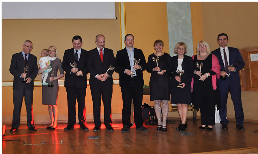
Laureaci konkursu VICTORIE 2014

Pięcioro absolwentów UEP znalazło się wśród laureatów VI edycji Konkursu o Nagrodę Prezesa Narodowego Banku Polskiego na najlepszą pracę magisterską z zakresu nauk ekonomicznych w 2013 roku: