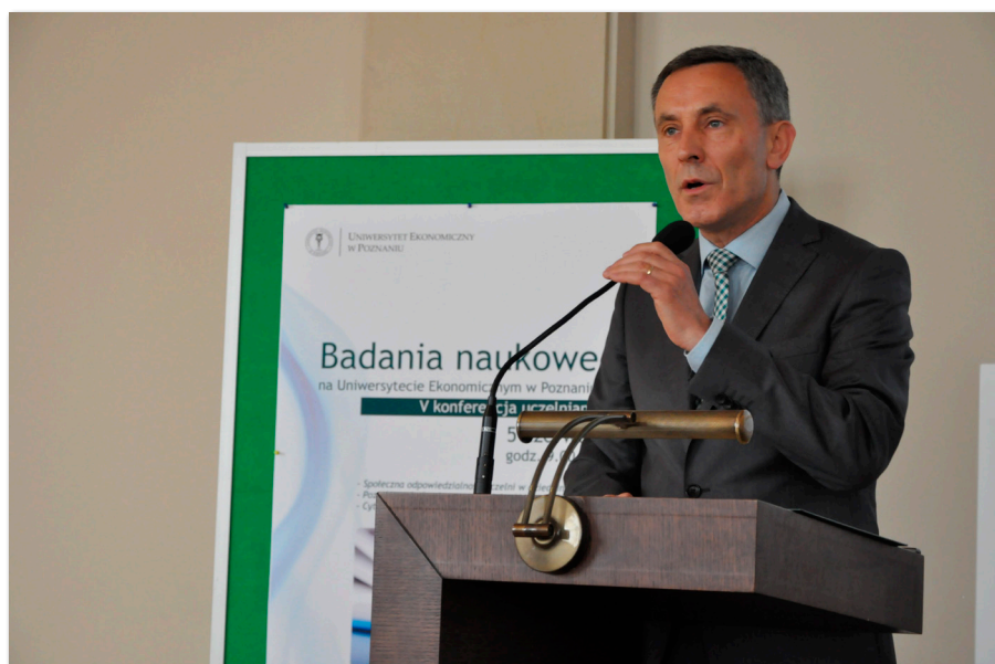
V Konferencja Uczelniana „Badania naukowe na Uniwersytecie Ekonomicznym w Poznaniu”