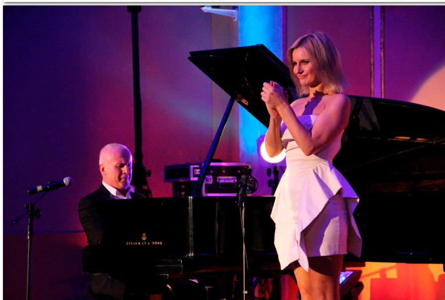
Gala VI Dni UEP