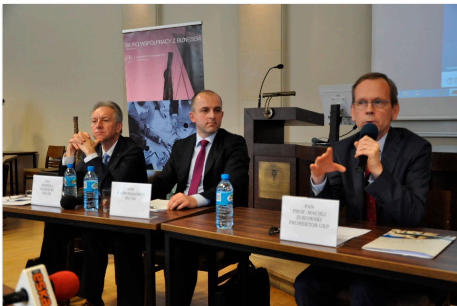
Debata pn. „Tylko ZUS czy ZUS i OFE?”