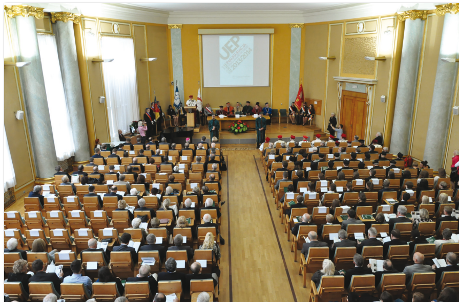
Inauguracja roku akademickiego UEP 2013/2014