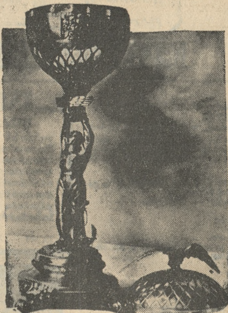
PUHAR IM. PŁK. WAŃKOWICZA

Jako pierwszy wystartował balon „Sanok” (Aeroklub Lwowski 1600 m 3 ,