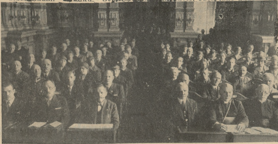
Uczestnicy VIII ogólnopolskiego Sejmiku Przeciwalkoholowego w sali Starostwa Krajowego w Poznaniu.

Wczoraj po nabożeństwie w kaplicy Najśw. Krwi Pana Jezusa przy ul. Żydowskiej rozpoczęły się w sali Starostwa Krajowego obrady plenarne VIII ogólnopolskiego sejmiku przeciwalkoholowego. Sala wypełniła się po brzegi uczestnikami sejmiku. Otwarcia