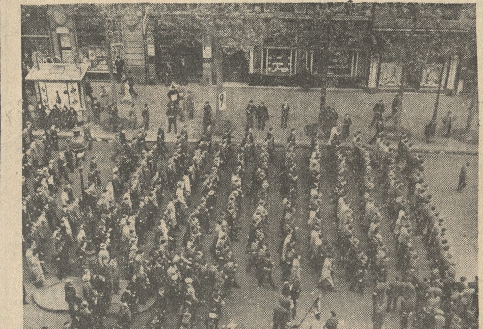
W całej Francji odbyły się uroczystości, poświęcone św. Joannie d'Arc. Na zdjęciu członkowie organizacji nacjonalistycznej „Croix du Feu“ (Ognisty Krzyż) w pochodzie na ulicach Paryża.

Ogółem 50 ofiar, — ludzi pochodzących ze wszystkich warstw społecznych.