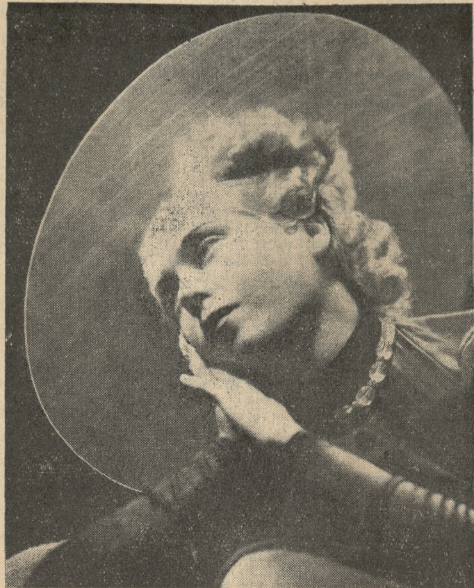
Z najnowszej mody paryskiej: — Wielki biały kapelusz „kryształowy”, przybrany hortensjami. Model: Agnès.

Rozzuchwalona swem powodzeniem, Titayna pewnego dnia powzięła zamiar zdobycia samolotem najwyższego szczytu Alp, Mont Blanc. W towarzystwie znanego lotnika Thoreta, Titayna wy-