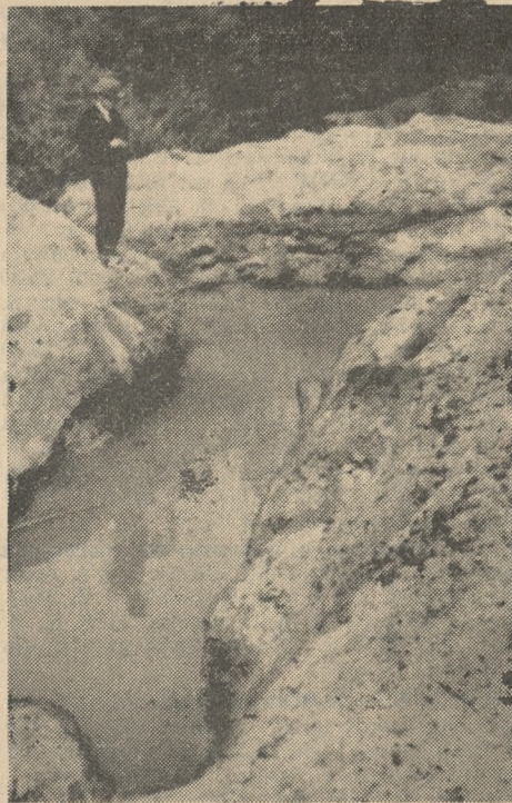
Obecny wygląd dołu, w którym ma tkwić meteor.

Jak się dowiadujemy, w najbliższych dniach podjęta ma być dalsza praca przy pomocy świadra, zamówionego w firmie St Wiorek i Spółka w Karpnie.