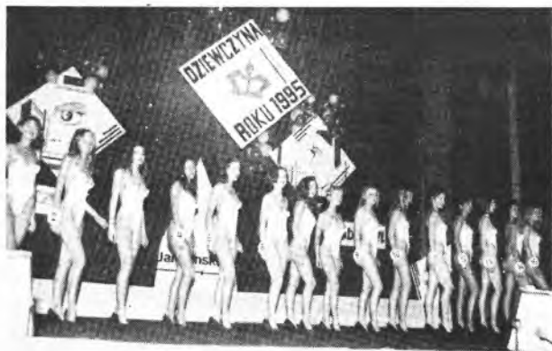
Napięcie rośnie - kostiumy kąpielowe z podpoznańskiego „PIK-a”.