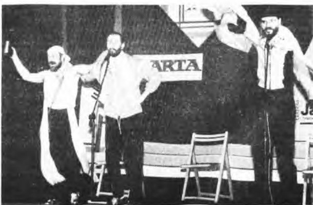
Kabaret „Paka” w akcji.