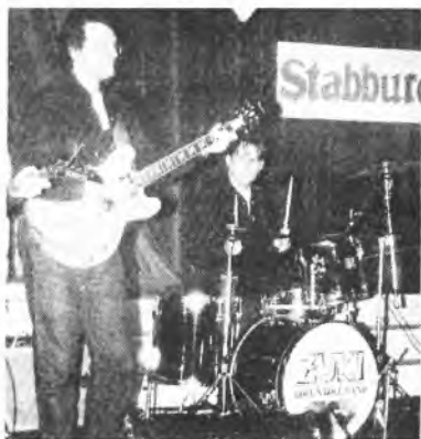
Nie ma to jak stare dobre przeboje "Czerwonych Gitar" i „The Beatles” w wykonaniu zespołu „Zuki”.