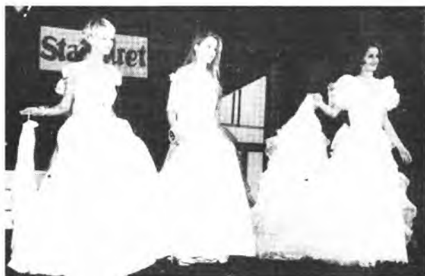
Białe zawrót głowy, czyli wielkie wyjście w sukniach ślubnych z Salonu Odzieżowego „Ewpol”.