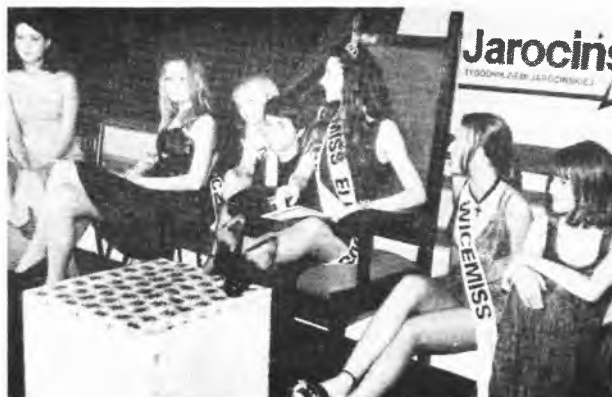
Po czterech godzinach koncertu marzy się tylko o tym, by położyć na czymś obolale nogi, nawet jeśli jest to główna wygrana - kolorowy telewizor.