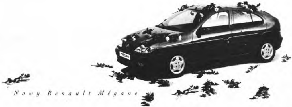
Nowy Renault Mégane