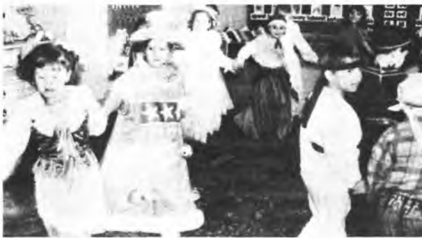
Dzieci podczas balu