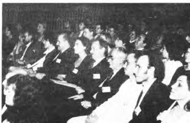
Nic się nie ukryje przed czujnym okiem jurorów.