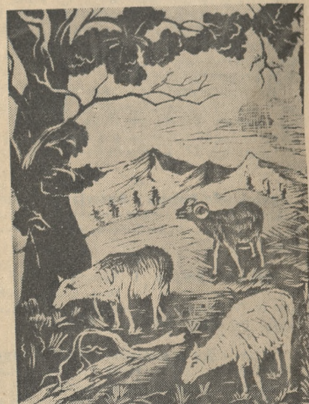
A. Kondratski: „Motyw górski”, drzeworyt kolorowany, — 14 x 19 cm — cena zł 8.

90 aut najdawniejszych typów wyruszyło ubiegłej niedzieli z Londynu do Brighton. W obecności wielotysięcznych tłumów wjechały sznurem auta - antyki do Hyde - parku. Po defiladzie nastąpił wyjazd do Brighton. Długim sznurem ciągnęły skrzypiące i stękające auta po