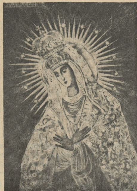
Stanisław Wojewódzki: „Matka Boska Ostrobramska”, suchoryt — 19 1/2 x 25 1/2 cm. — cena zł 9.

Wreszcie pewnej nocy wstał i udał się nad rzeczkę. Wyciągnął pocisk z