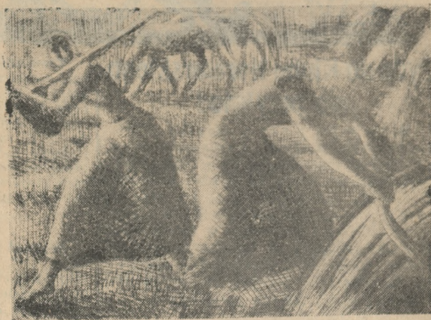
Jan Grzegorzewski: „Żniwiarki”, suchoryt — 16 x 21 cm. — cena zł 8,—