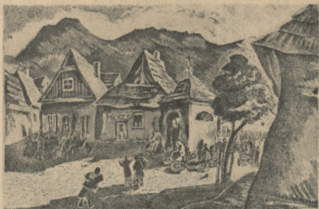
L. Lanżanka: „Muszyna”, akwatinta — 16 x 21 cm. — cena zł 10,—