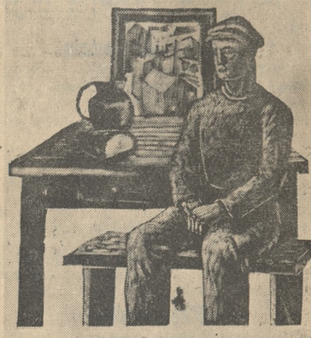
R. T. Wilkanowicz: „Robotnik”, drzeworyt — 15 x 15 cm — cena zł 10.

szosie. Zwycięzcą w tym osobliwym wyścigu był wóz najstarszy, Daimler z 1894 roku, który przebiegł dystans 100 km dzielący Londyn od Brighton w 6 godzin. Jeden z uczestników wyścigu, książę sjamski Birabongse, jechał na wozie Peugeot z r. 1902 (6 1/2 godzin). Ostatni przyszedł do mety wóz z r. 1895. Wszystkie wozy musiały zatrzymać się w połowie drogi w Crawley i brać benzynę. W Brighton nastąpił przymusowy postój na noc, albowiem światła aut - antyków nie odpowiadają już nowoczesnym przepisom drogowym.