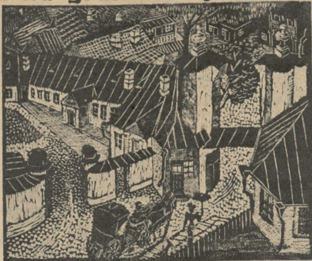
Z. Małachowska: „Motyw z Krzemieńca”, drzeworyt — 25 x 30 cm. — cena zł 10,—