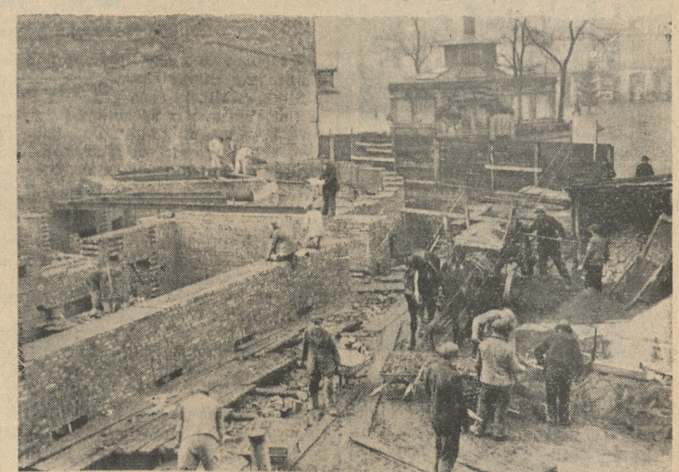
Tak wygląda stan budowy ośrodka zdrowia, wznoszonego przy Placu Kolegiackim.