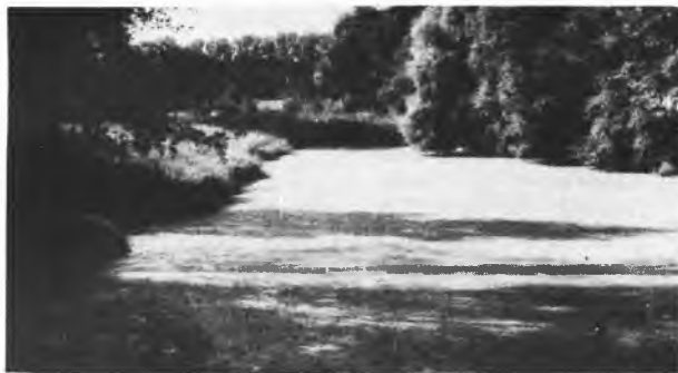
Powoli zarastający pierwszy staw przepływowy

razu. W tym czasie nie szczędzono środków na ich utrzymanie uważając, że są ważną częścią składową tamtejszej gospodarki wodnej. Po wojnie sytuacja zaczęła się zmieniać na niekorzyść akwenów, które ostatecznie znalazły się w rękach trzech różnych gospodarzy.