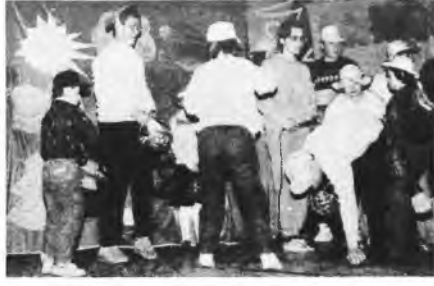
Inscenizacja bajki o Czerwonym Kapturku

zетки - a następnie udali się do JOK-u. Zanim rozpoczęła się część artystycz- na dyrektor Romuald Gruchalski