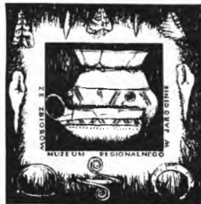
Ekslibris podarowany muzeum przez Cz. Woś

W związku z otwarciem wystawy Władysław Kościelniak przekazał na rzecz muzeum zbiór swoich rysunków przedstawiających obiekty Ziemi Jarocińskiej. Czesław Woś podarował specjalnie wykonany dla muzeum nowy ekslibris. (jk)