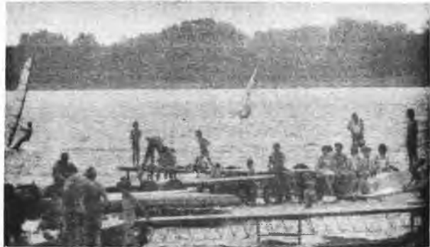
Na plaży w Skorzęcinie

Osoby, których nie stać na korzystanie z ofert biur podróży starają się same zorganizować wypocznik dla siebie i rodziny. Najczęściej są to kilkudniowe wyjazdy nad jezioro pod namiot (niektórzy korzystają z domków zakładowych). Najliczniej odwiedzanym ośrodkiem wczasowym niedaleko