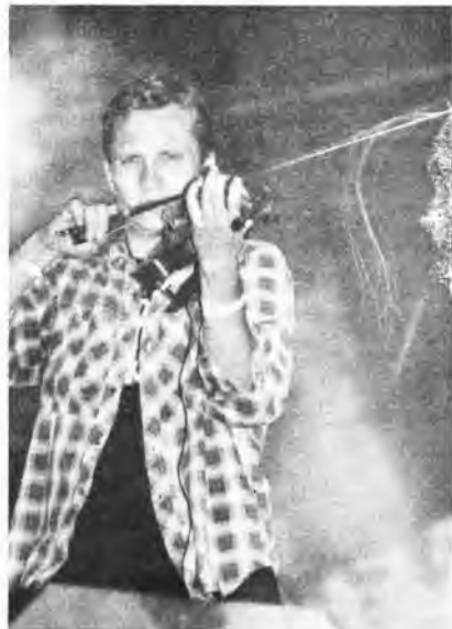
Skrzypek z zespołu „ANKH”

Baliśmy się przed wejściem na Dużą Scenę, ale było bardzo fajnie. Jednak przede wszystkim byliśmy bardzo zestresowani.