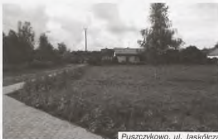
Puszczykowo, ul. Jaskółcza