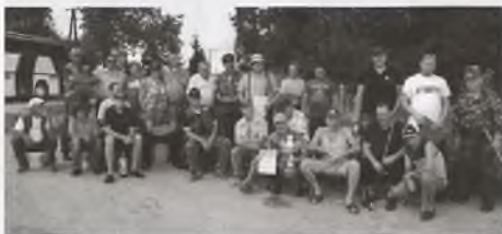
Uczestnicy Pucharu Prezesa.