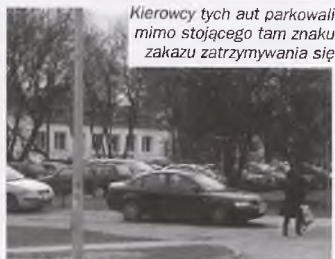
Kierowcy tych aut parkowali mimo stojącego tam znaku zakazu zatrzymywania się