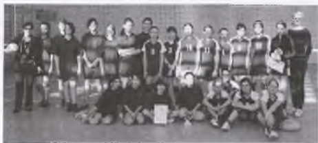
Szkoła Podstawowa nr 1