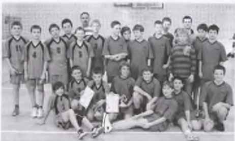
Szkoła Podstawowa nr 2