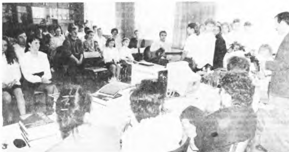
Przybyli wszyscy laureaci.