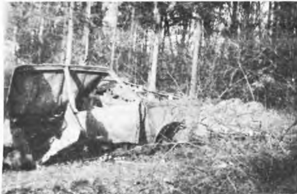
Las czy śmietnisko???

★ ZMNIEJSZAJĄ HAŁAS ; pas lasu liściastego szerokości 150 m obniża siłę dźwięku o 18 - 25 decybeli. (rws)