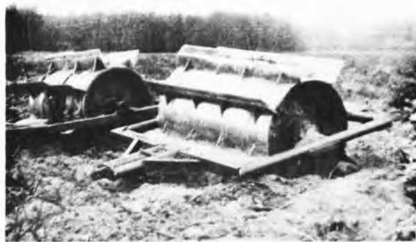
Ciężkie walce - OTL działają skutecznie