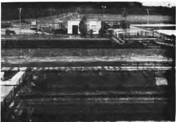
Fragment oczyszczalni ścieków w Cielczy dla miasta Jarocina