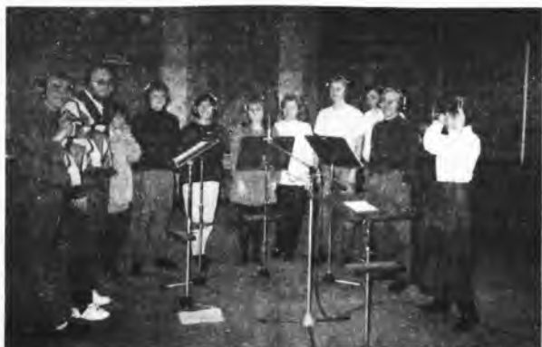
Zespół w studiu nagran

Kasetę można będzie kupić już w tym tygodniu w księgarni „Na rogu”. (refb)