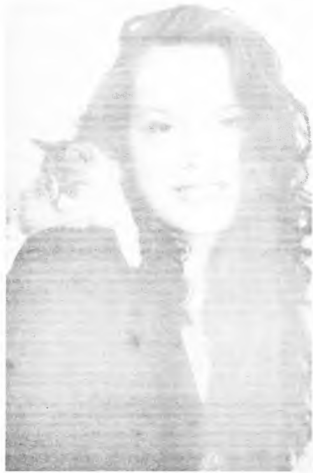
"Kobiety są kwiatami, bezustannie zwracają się do światła i jak kwiaty potrzebują słońca, aby się rozwijać" - Aleksander Dumas