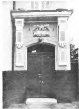
Obecna siedziba szkoły

Corocznie najzdolniejsi uczniowie szkoły biorą udział w regionalnych i ogólnopolskich konkursach szkół muzycznych. Szkoła prowadzi rów-