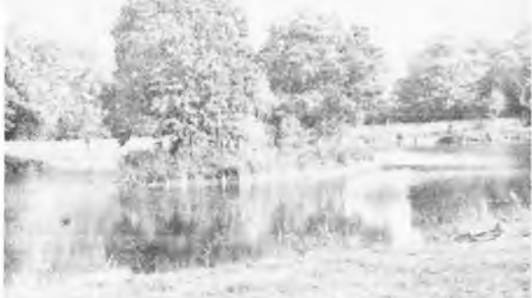
Przebudowany staw z wyspą