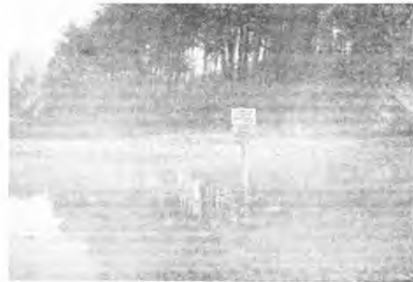
Tramwaj w osady "Moczydło" nad Wartą

Obszar rzeki Warty wraz ze starorzeczami w gminach województwa poznańskiego jest użytkowany przez Polski Związek Wędkarski Zarząd Okręgu w Poznaniu na podstawie umowy dzierżawnej, zawartej na czas nieograniczony z wojewodą poznańskim. Ponadto Zarząd Okręgu PZW decyzją Nr OS IV-7211 z dnia 20 maja 1981 r. uzyskał pozwolenie wodno-prawne na korzystanie z tych wód dla celów ryba-