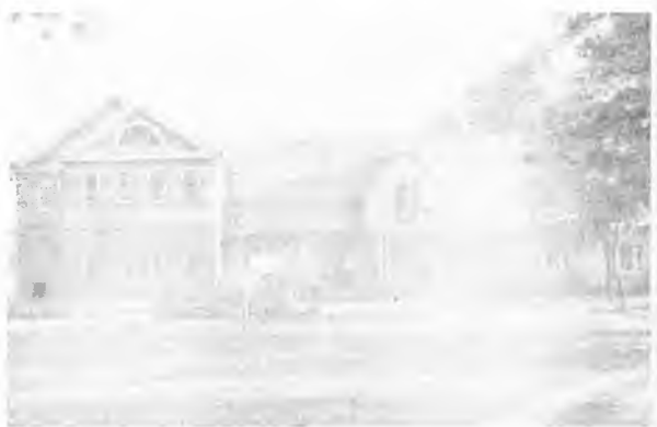
Przebudowa dworku - 1813 r. część gospodarska parku

W części gospodarskiej parku gestwo zadrzewienie występuje jedynie w zachodnim pobrzeżu stawu, gdzie w wąskim pasie ok. 5 metrów występuje po kilka dębów szypułkowych, lip, klonów, jesionów i giągów o grubości 20 - 40 cm. Wschodnie podrzeże parku gospodarskiego jest zadrzewione, tylko na południowym odcinku, szczególnie przy granicy z parkiem gminnym. Znajdują się tam graby, kilka brzoź, klony, dągleje, świerki oraz żywotniki. Po bokach zajazdu przeddworskiego rośnie również kilka klonów, jesionów i żywotników oraz dwa modrzewie, a w zakrzaczeniu występuje smaganecka, bez lilak i bez czirny. Połacie trawiste przed dworkiem ozdobione jest żywopłotem i ke-