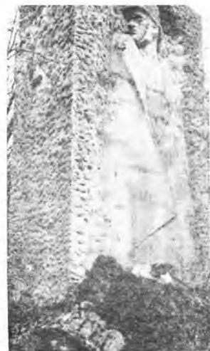
Pomnik Nieznanego Żołnierza Niemieckiego

Jak dotąd w sprawie cmentarza nie podjęto żadnych konstruktywnych decyzji. Dlaczego? Można by sądzić, że wpłynęła na to brak środków finansowych. Nie jest to jednak prawdą. Na koncepcję księdza Lemańskiego nie zgodzono się. Dziwi to, że wycina się młody drzewostan, aby stworzyć nowe miejsca pochówku, gdy tymczasem stary cmentarz zarasta. Można wątpić w słuszność podjętych przez Urząd Wojewódzki decyzji, zważywszy na to, że nieopodal znajdują się duże obszary leśne. Brak w tym wszystkim jakiegos logicznego porządku. Zdumiewa fakt, że UMiG wydaje decyzję o wstrzymaniu wszelkich działań, działań, których chyba nigdy nie podjęto. Tak przynaj-