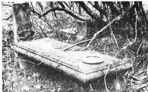
Jeden z nielicznych zachowanych grobów

Dalsze losy tego cmentarza zapisze historia. Jakie one będą - trudno dziś przewidzieć. Z przedstawionych powyżej faktów wynika, że wszystko zależy od decyzji parlamentu. Znaję jednak opeźność naszych posłów i senatorów nie należy się chyba spodziewać szybkiego zakończenia tej sprawy.