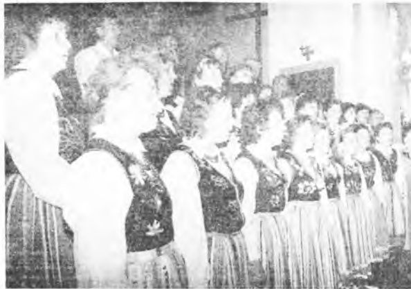
Podczas występu w kościele.

Wszystkie wymienione placówki prowadzą klasy zerowe. (rk)