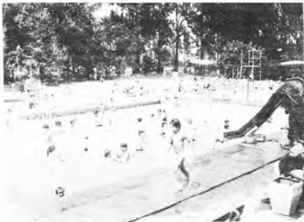
Basen w Jarocinie

Na "parowozowni" przy niewielkim stawku również znajduje się tablica zabraniająca kąpeli. Nie przekradzało to około 100 osobom, także