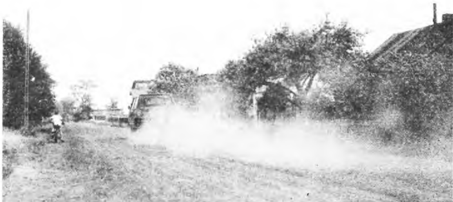
Na ul. Wybudowanej