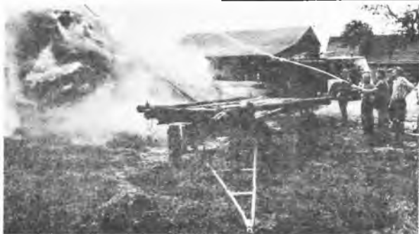
Pożar w gm. Jaraczewo

Od 30 czerwca do 5 lipca strażacy interweniowali przy 14 pożarach. Najczęściej paliła się przydrożna trawa i poszycie leśne. Spaliły się również dwa stogi. W Jaraczewie spłonęło 20 t słomy, pożar wywołał bawiący się zapalnikami syn właściciela. W Hilarowie (gm. Jarocin) od iskry z ciągnika spalił się stóg wraz z ciągnikiem i przyrzepa. (rj)