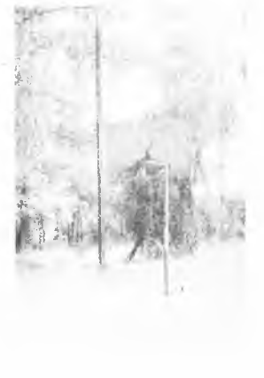
Boisko (?) do kosza