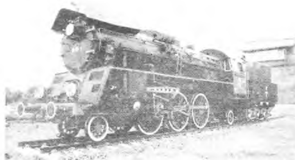
Zabytkowa lokomotywa znalazła swe miejsce