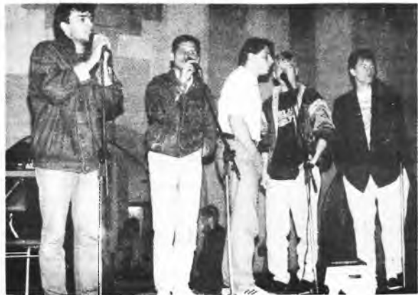
Na Rynku 29 maja

Byłam zdumiona, że organizatorom chciało się wymyślać sprzęt. A skoro go już wyjęli, to mogli zaprosić zespoły, które działały w Jarocinie. Nikt jednak na to nie wpadł. Pokazano to, co prezentowane było już kilka razy,