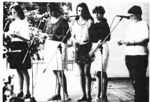
Spiwają dzieci z Francji