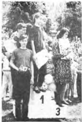
Zwycięskie drużyny na podium

i zaangażowanie wcale nie było mniejsze. W turnieju tenisa ziemnego najlepszym okazał się Grzegorz Wasielewski (SzP Nr 4), przed Maciejem Wiśniewskim (SzP Nr 4), Jarosławem Lorencem (SzP nr 2) i Marcinem Kuropką (SzP Nr 4). W popularyzowanej przez MOSiR grze "boules" najlepszymi okazali się