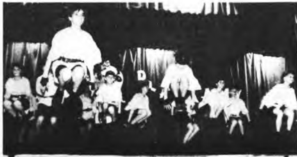
Zespół „Ares” - II miejsce na XII Wojewódzkim Przeglądzie Szkolnych Zespołów Rytmiki i Tańca