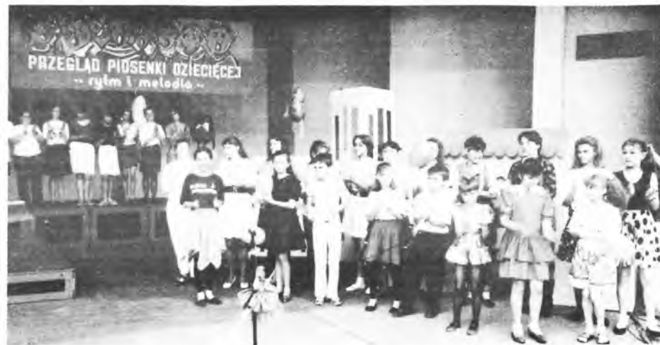
Na koncercie galowym

dzieci młodsze - w wieku przedszkolnym. Przegląd byłby rzeczwiście prezentacją piosenki prawdziwie dziecięcej. Nie by się nie stało przecież gdyby któreś dziecko troszeczkę zafalowało czy pomyliło się. Takie jest prawo małych, które się dopiero uczą śpiewać i występować przed publicznością. Nie chodzi tutaj przecież o wyśmienity poziom, ale o wspólną zabawę