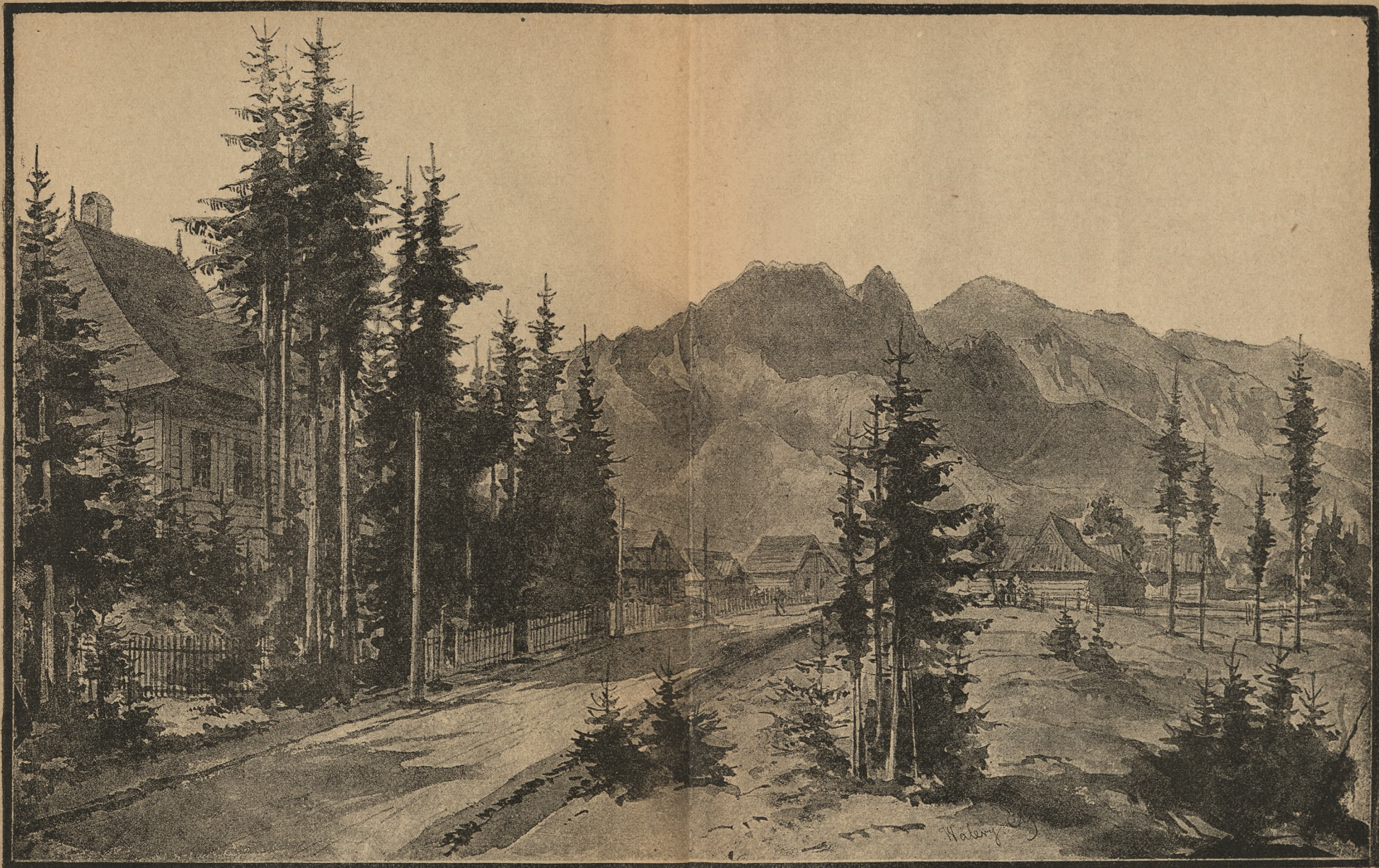
GLÓWNY WJAZD DO ZAKOPANEGO.