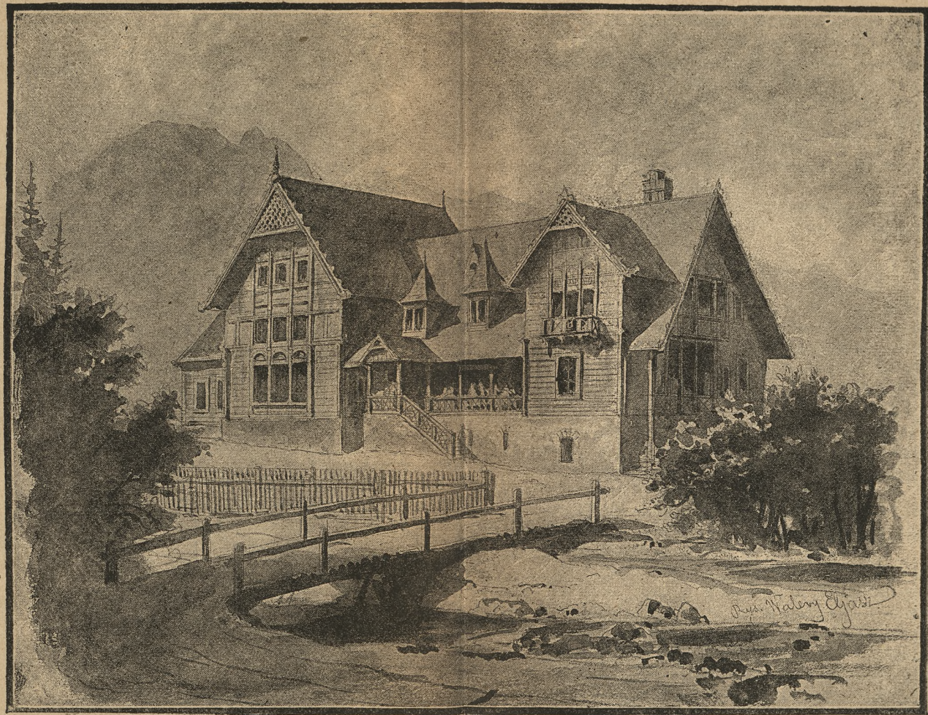
Dworzec tatrzański w Zakopaném.