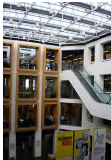
Biblioteka w Kolding

Ale Dania to nie tylko nowoczesne biblioteki, to także kraj o ponadtyśiącletniej historii i bogatej kulturze, który wydał wiele wybitnych postaci. Zwiedzanie zaczęliśmy od małej wioski położonej w środkowowschodniej części Jutlandii: Jelling, będącej jednocześnie kolebką duńskiej państwowości. To tutaj znajduje się jeden z najstarszych kościołów Danii, a także prastare kurhany i glazy pokryte pismem runicznym. Odense, trzecia co do wielkości aglomeracja Danii, położona na