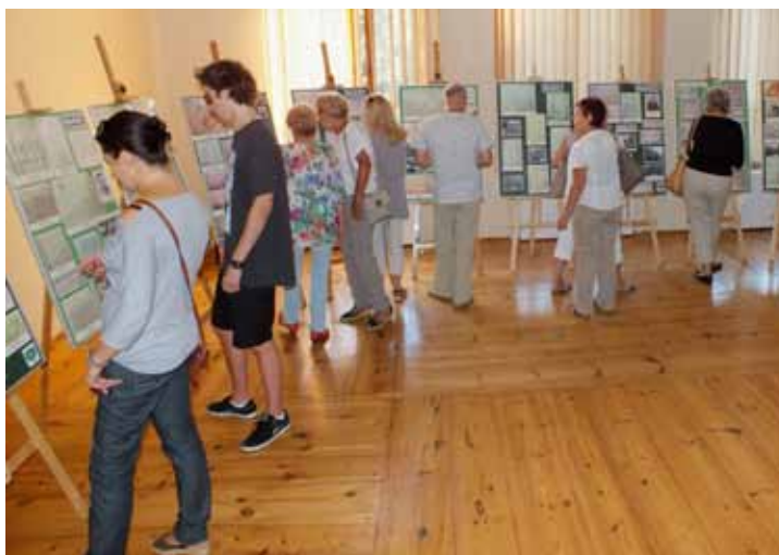
Wystawa „Kalisz 1913 r.”