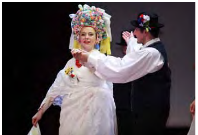
„Poznański podkociołek” obrazek zwyczajowy prezentujący folklor dawnych ...i Bambrów Poznańskich wsi miasta Poznania...

13 października zakończył się w Kielcach VIII Ogólnopolski Festiwal Zespołów Artystycznych Wsi Polskiej. Przegląd, po 16 latach przerwy, z rozmachem powrócił na scenę Wojewódzkiego Domu Kultury w Kielcach.