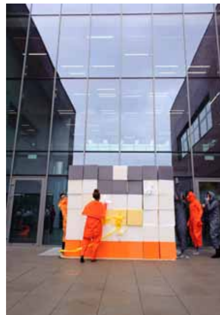
Grupa teatralna Niegrzeczne Dzieci układa logo CKiBP w Suchym Lesie

W nowej siedzibie do dyspozycji użytkowników pozostaje 3 tys. m 2 powierzchni, na której rozmieszczonych jest aż dziesięć sal tematycznych; w tym pracownia plastyczna, malarska, teatralna, muzyczna, baletowa, sala widowiskowa mogąca pomieścić przeszło 200 osób oraz ogromnych rozmiarów biblioteka mieszcząca się na pierwszym piętrze. Dla porównania, obecna przestrzeń jest piętnastokrotnie większa od tej, którą Ośrodek Kultury wspólnie z Biblioteką Publiczną zajmowały przy ul. Bogusławskiego 17.