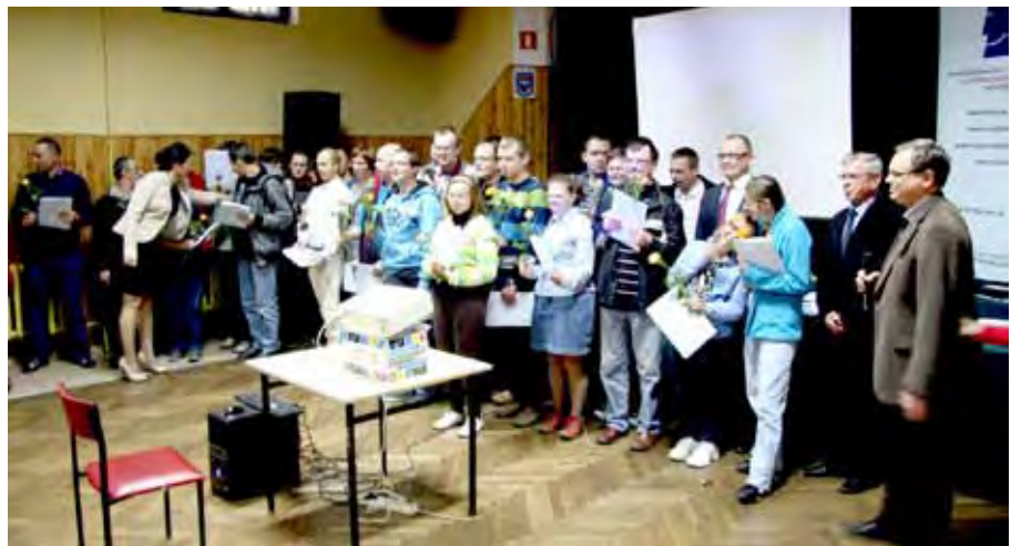
Uczestnicy czerwcowych warsztatów podczas październikowego spotkania

Na początku wszystkim uczestnikom został zaprezentowany film zmontowany ze zdjęć wykonanych w czerwcu. Przy podkładzie pięknej muzyki przenikały się setki zdjęć, któ-