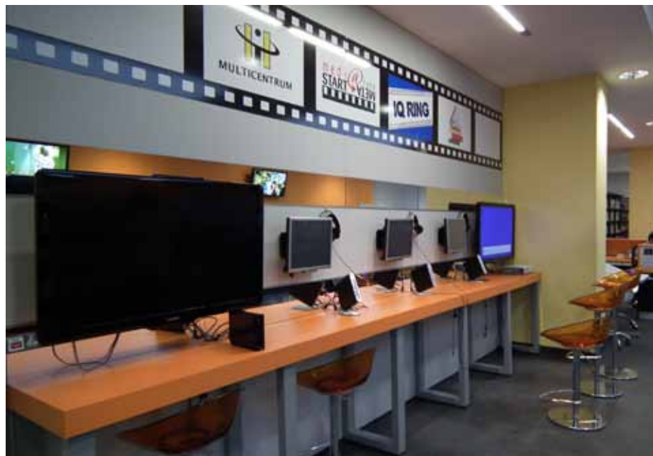
Filia Biblioteki Publicznej Dzielnicy Bielany – Mediateka Start-Meta

http://www.biblioteki.org/pl/o_finansach_w_bibliotece_2_edycja/aktualnosci