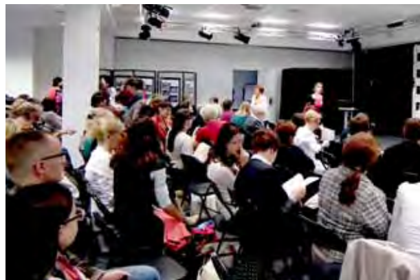
Uczestnicy spotkania podsumowującego projekt

Goszcząca biblioteczka Mediateka jest jedną z najnowocześniejszych bibliotek multimedialnych w kraju. Zajmuje powierzchnię 1600 m 2 , posiada bogate zbiory multimedialne (muzyka, audiobooki, filmy, gry, winyle), nowoczesne stanowiska internetowe, stanowiska do nauki programowania, projektowania plastycznego, tworzenia muzyki, pracownice doświadczalne z dziedziny fizyki i chemii (energia solarna, wiatrowa). Mediateka chętnie gości u siebie bibliotekarzy i organizuje różne wydarzenia.