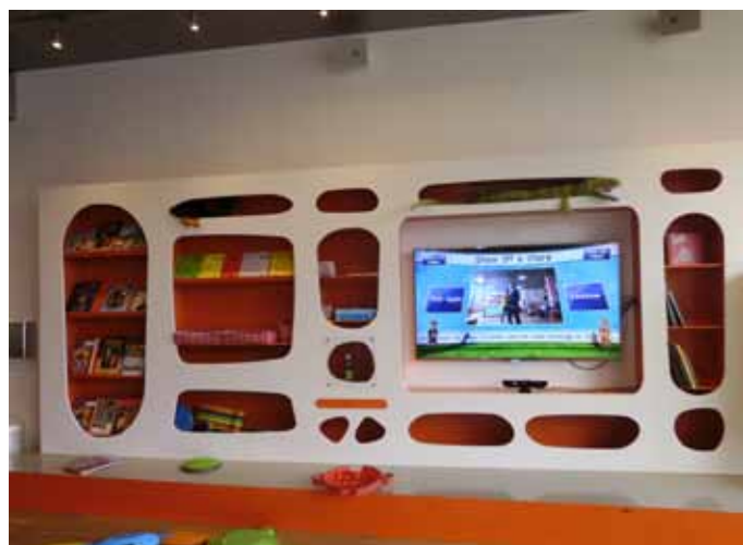
Biblioteka w Helsingor