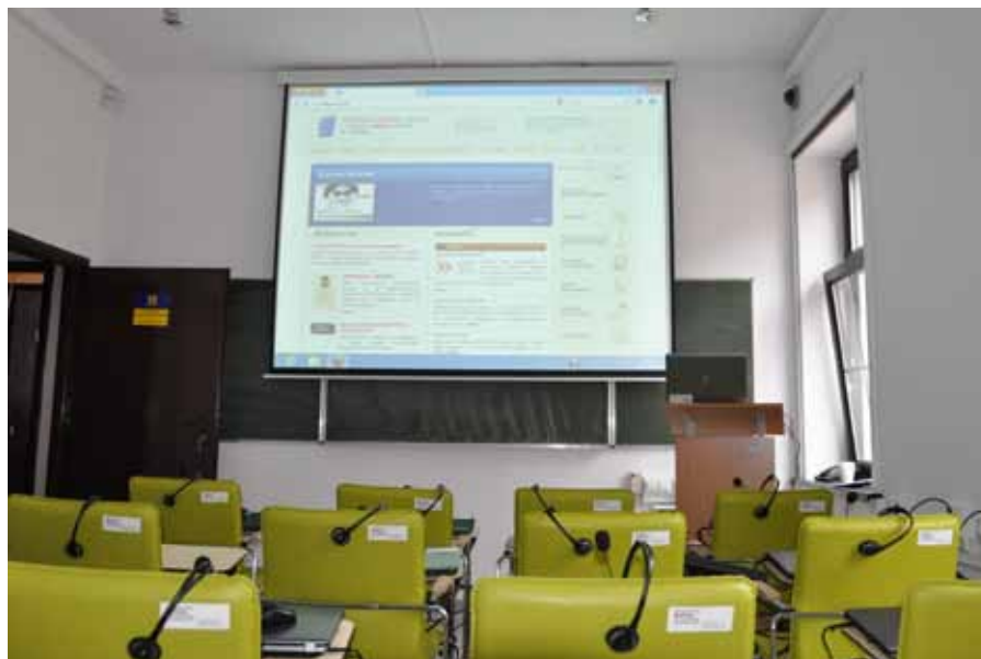
Zmodernizowana pracownia komputerowa

Ministerstwo Kultury i Dziedzictwa Narodowego.