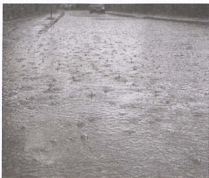
Studzienka na ul. Szkolnej