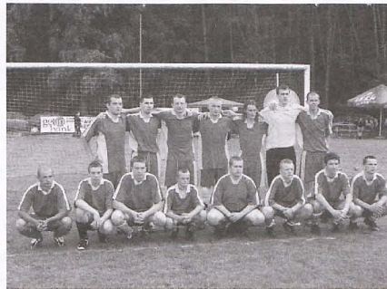
BRO TEAM WITOWO