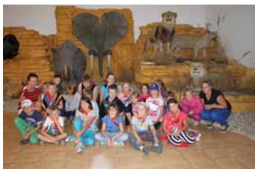
Uczestnicy wycieczki do Muzeum Przyrodniczo-Łowieckiego w Uzarzewie

Ostatniego dnia wakacyjnej akcji wybrano się do Muzeum Przyrodniczo-Łowieckiego w Uzarzewie. W XIX-wiecznym pałacu najmłod-