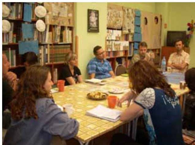
Uczestnicy spotkania DKK

23 lipca członkowie DKK działającego przy gnieźnieńskiej bibliotece rozmawiali o książce Ryszarda Kapuścińskiego „Busz po polsku”, która jest zbiorem reportaży publikowanych na łamach tygodnika „Polityka” w latach 1958-1961.