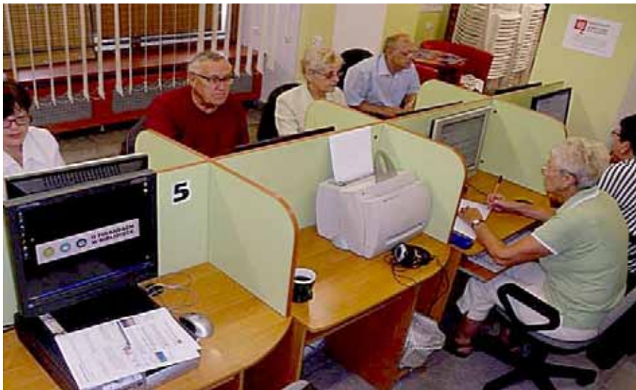
Kursanci w bibliotece w Jarocinie

11 bibliotek publicznych z województwa wielkopolskiego, które przystąpiły do drugiej edycji projektu „O finansach ... w bibliotece” – zrealizowało szkolenia dla osób po 50 roku życia.