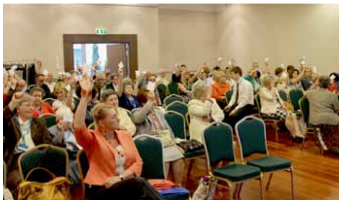
Członkowie SBP w trakcie głosowania

Od 7 do 8 czerwca 2013 r. w Warszawie odbył się Krajowy Zjazd Delegatów Stowarzyszenia Bibliotekarzy Polskich, podczas którego dokonano podsumowania kadencji 2009-2013, określono kierunki rozwoju organizacji i wybrano nowe władze na kadencję 2013-2017.