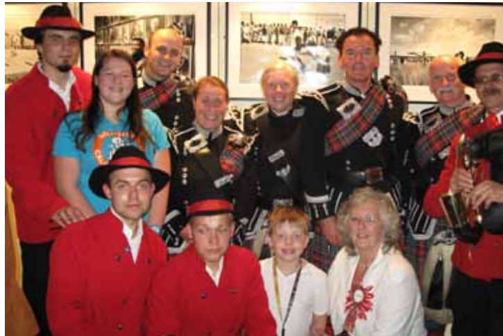
Kapela Dudziarska „Kozłary” w Edynburgu

Od 22 do 26 sierpnia Kapela Dudziarska „Kozłary” z Domu Kultury w Sęszewie wzięła udział w czterech spotkaniach z widownią szkocką podczas trwania Festiwalu Teatrów Ulicznych w Edynburgu.