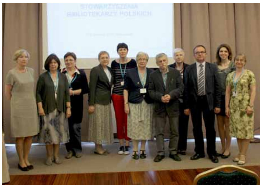
Nowo wybrany Zarząd SBP