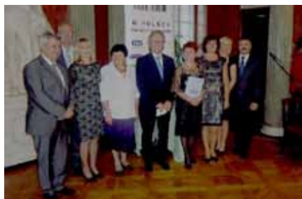
Laureaci XIX edycji Edycji Konsumenckiego Konkursu Jakości Usług

Przyznanie Certyfikatu upoważnia do umieszczenia na materiałach reklamowych prestiżowego godła „Najlepsze w Polsce” – „The Best in Poland” przez najbliższe trzy lata. Podsumowanie