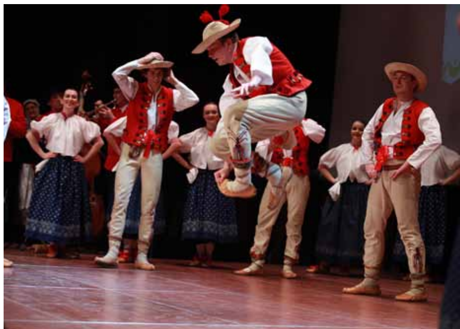
P. Kulka Zespół Wielkopolanie w tańcach góralskich Beskidu Śląskiego

Grand Prix zdobył zespół „Majek” z czeskiego Brna. Przyznano sześć nagród regulaminowych. Jedną z nich za stylową prezentację wielkopolskich zwyczajów karnawałowych w strojach, muzyce, tańcach i rekwizytach otrzymał Zespół Folklorystyczny „Wielkopolanie” z Poznania. Spotkania zorganizowano w ramach 50. Tygodnia Kultury Beskidzkiej.