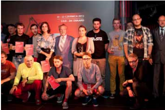
Jurorzy i laureaci Ogólnopolskiego Konkursu Filmów Niezależnych

22 czerwca 2013 r. uroczystą galą zakończyła się 59. edycja OKFA – Ogólnopolskiego Konkursu Filmów Niezależnych im. prof. Henryka Kluby w Koninie, podczas której wręczono nagrody najlepszym twórcom.