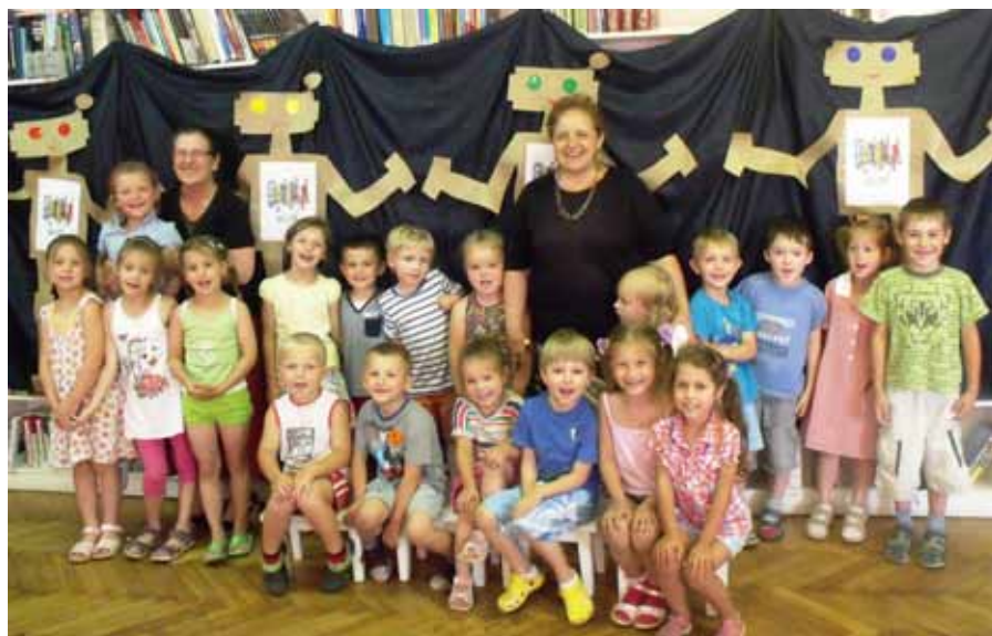
Uczestnicy wakacyjnych zajęć w Zdunach

Nie obyło się bez zajęć plastycznych. Kolorowanie Siecio Mazajek nie sprawiło nikomu żadnych problemów. Wszystkie prace zostały zszyte i powstały „książki” z zasadami bezpiecznego surfowania w internecie. Starsze dzieci i młodzież malowały swoje sylwetki, by stać się grupą Sieciaków, której przewodzą Ajpi, Netka, Spociak i Kompel.