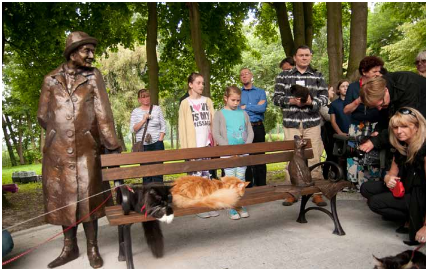
Wisława Szymborska w otoczeniu ukochanych kotów

W przededniu wypadającej 2 lipca 90. rocznicy urodzin Wisławy Szymborskiej, 29 czerwca w Kórniku zorganizowano okolicznościowe wydarzenie. Świętowanie zainaugurowano w Kórnickim Zamku, gdzie otwarto wystawę wyklejanki Wisławy Szymborskiej oraz dokumentów i pamiątek, które pozostawiła Bibliotece Kórnickiej PAN. Po wernisażu goście razem z aktorami Teatru Legion przeszli na kórnicki Prowent, w którym urodziła się poetka. Podczas kilku przystanków aktorzy przedstawili krótkie scenki oparte na wierszach Szymborskiej.