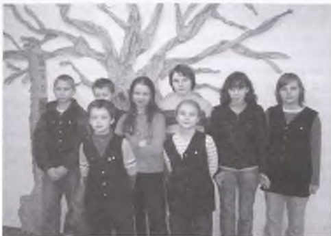
Finałiści z Boguszyna