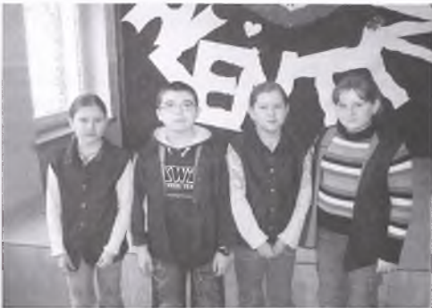
Finałiści z Chociczy