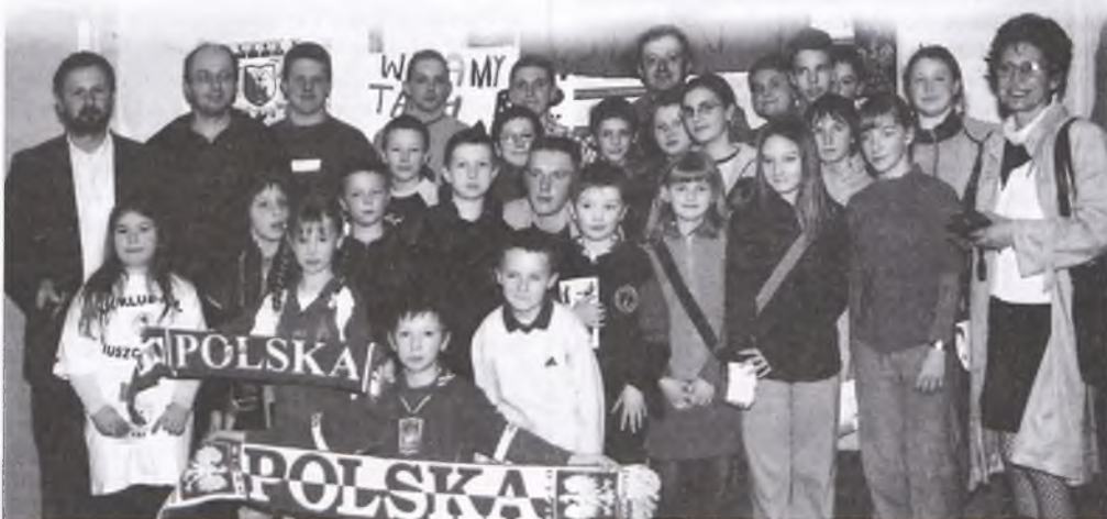
Król Olaf I (tak napisano na transparencji) - w otoczeniu fanów

W czasie kolejnych swoich zebrań, które odbywać się już będą w jednej z sal „starej” szkoły w Puszczykowie, udostępnionej Radzie Rodziców przez Burmistrza Miasta, fanklubowicze rozmawiać będą między sobą na temat wyników ukochanej drużyny, poszczególnych jej zawodników i ich dokonań artystycznych. Chcą też „na bieżąco” dekorować swoją