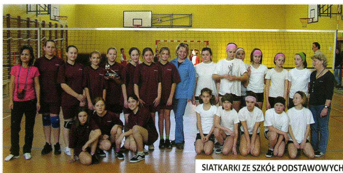
SIATKARKI ZE SZKÓŁ PODSTAWOWYCH