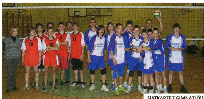
SIATKARZE Z GIMNAZJÓW