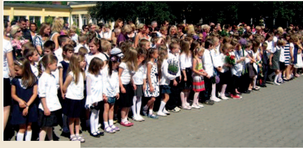
Szkoła Podstawowa nr 2