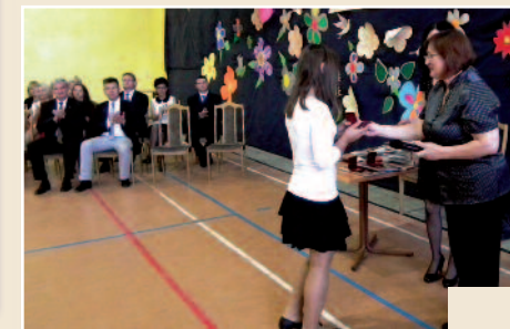
Szkoła Podstawowa nr 2