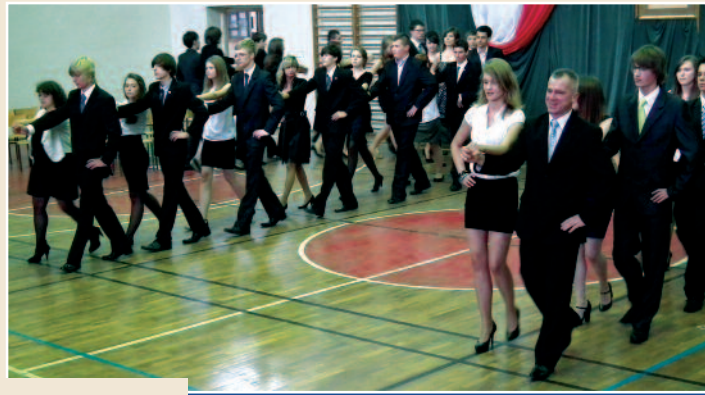
Gimnazjum nr 1

Wszystkim uczniom puszczykowskich szkół życzymy udanych, wesołych i przede wszystkim bezpiecznych wakacji.