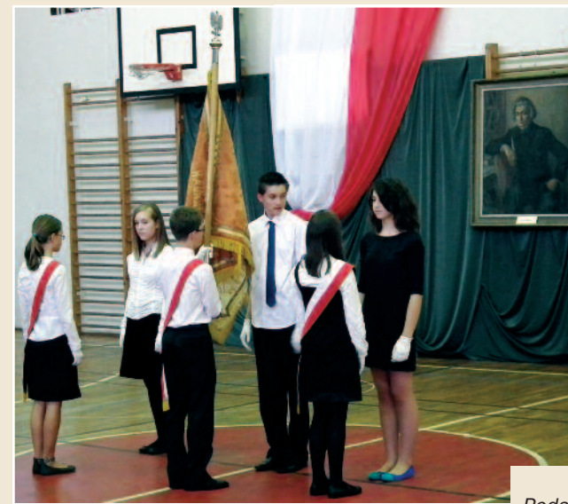
Szkoła Podstawowa nr 1