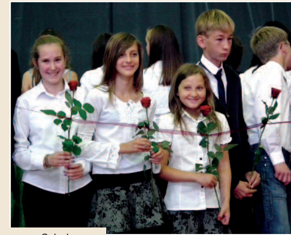
Szkoła Podstawowa nr 1