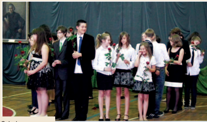
Szkoła Podstawowa nr 1