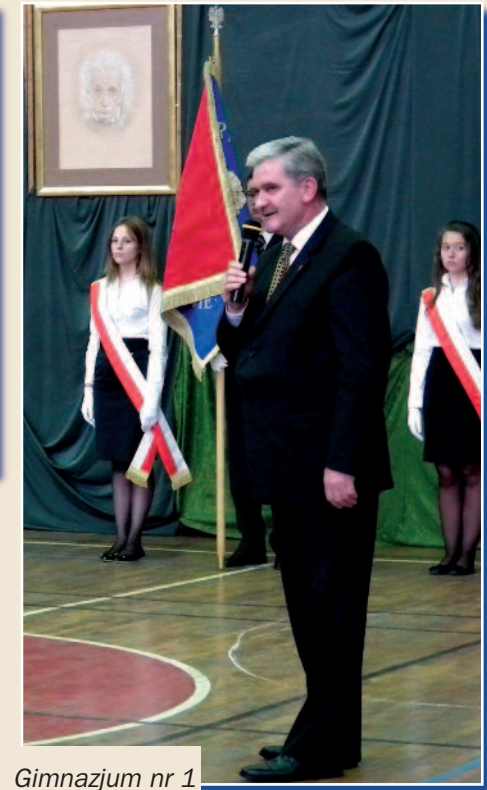
Gimnazjum nr 1