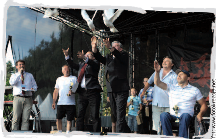
Podczas festynu zwycięskie gołębie pocztowe lotu z Burg zostały wypuszczone w niebo.