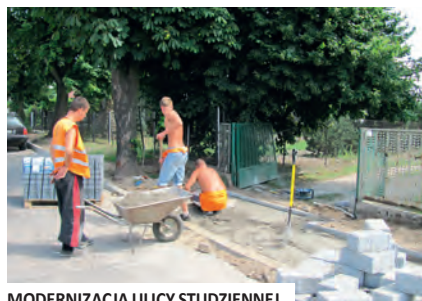
MODERNIZACJA ULICY STUDZIENNEJ

Ⓢ | W wakacje prace inwestycyjne w mieście trwają w najlepsze. Rosną mury budynku Szkoły Podstawowej nr 2 i Gimnazjum nr 2 przy ul. Kasprowicza, trwa modernizacja ulic Studziennej i Czarnieckiego. Rozpoczęła się budowa ul. Gołębiej. Powstaje też kolejny Orlik, czyli kompleks boisk.