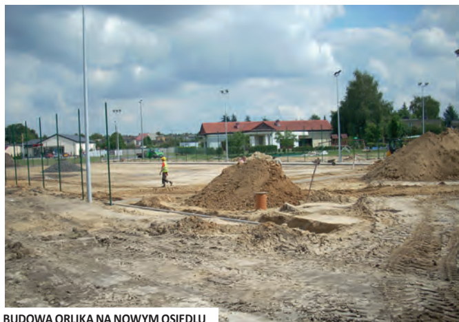
BUDOWA ORLIKA NA NOWYM OSIEDLU