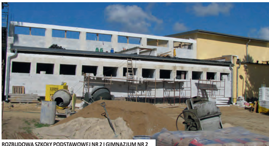
ROZBUDOWA SZKOŁY PODSTAWOWEJ NR 2 I GIMNAZJUM NR 2

Na początku sierpnia odbył się również przetarg na płytę Rynku. Więcej o zagospodarowaniu Rynku piszemy obok. | LM