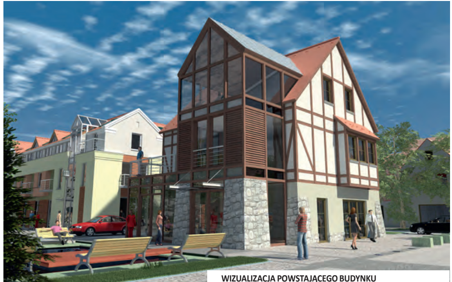
WIZUALIZACJA POWSTAJĄCEGO BUDYNKU

Budynek w środkowej części placu był od początku elementem pierwotnej koncepcji zagospodarowania Rynku. Miała tam powstać galeria miejska i punkt informacji