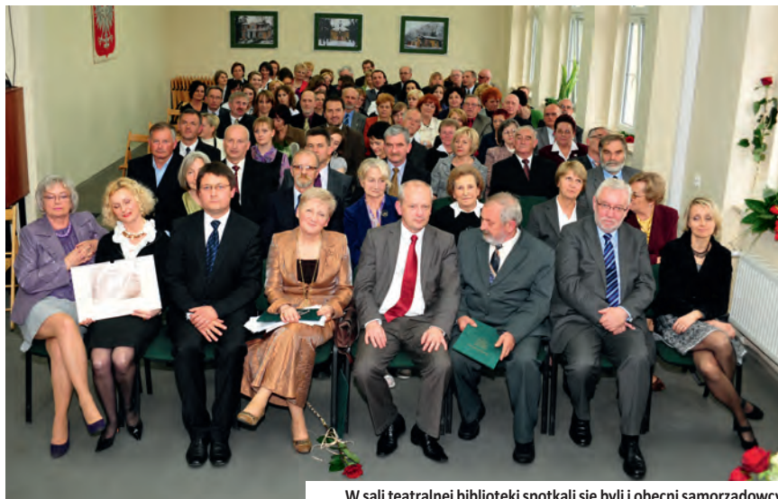
W sali teatralnej biblioteki spotkali się byli i obecni samorządowcy