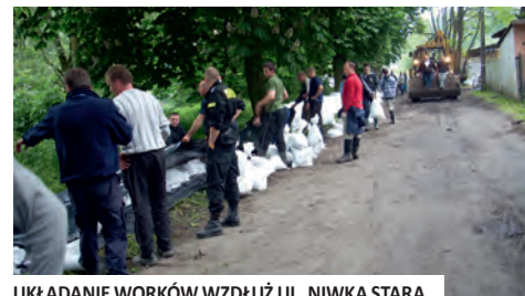
UKŁADANIE WORKÓW WZDŁUŻ UL. NIWKA STARA