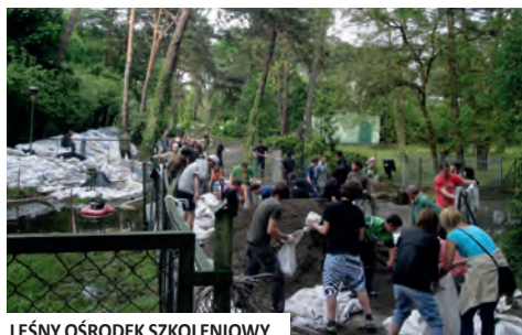
LEŚNY OŚRODEK SZKOLENIOWY