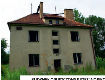
BUDYNEK OPUSZCZONY PRZEZ WOJSKO

☞ | W najbliższym czasie zaniebany i opuszczony przez wojsko w latach 90. ubiegłego wieku budynek zatętni życiem na nowo. Rozpoczęty pod koniec ub. roku kapitalny remont budynku zakończył się na początku czerwca. Wyremontowane mieszkania zostały przekazane nowym mieszkańcom.