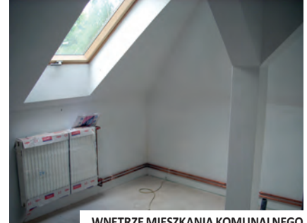
WNĘTRZE MIESZKANIA KOMUNALNEGO

Na przełomie roku 2009 i 2010 zweryfikowana została lista osób, którym przysługują mieszkania komunalne. W wyniku analizy kryteriów, którym przyporządkowano określoną liczbę punktów, sporządzono aktualną listę, na której znalazło się 25 rodzin. W maju odbyły się trzy posiedzenia Komisji Mieszkaniowej, która pozytywnie zaopiniowała propozycje Burmistrza Miasta