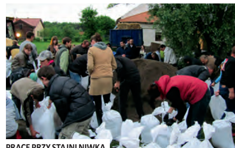
PRACE PRZY STAJNI NIWKA