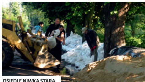
OSIEDLE NIWKA STARA