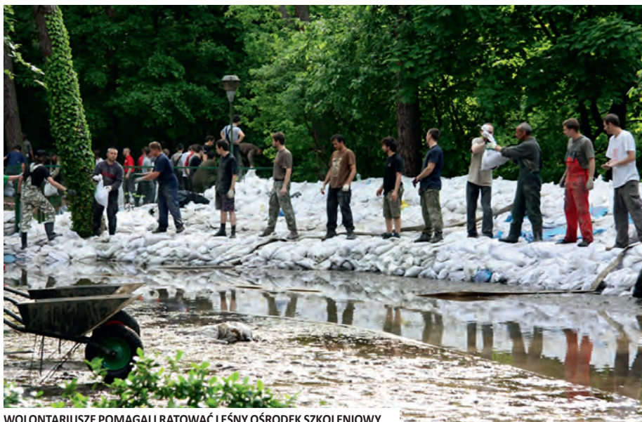
WOLONTARIUSZE POMAGALI RATOWAĆ LEŚNY OŚRODEK SZKOLENIOWY

Noc z 28 na 29 maja – poziom wody wzrasta o kolejne 5 cm. Puszczykowo jest ciągle monitorowane w miejscach najbardziej zagrożonych zalaniem. Na drodze między dworcem PKP a skrzyżowaniem z drogą 430 w Łęczycy zasypany zostaje przepust, żeby woda nie dostała się w stronę miasta. Zbudowane w ostatnich dniach wały nasiąknięty wodą, która znajduje ujście i przecieka. Wał umocniono ziemią i workami. W dalszym ciągu najtrudniejsza sytuacja jest w ośrodku.