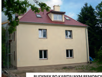
BUDYNEK PO KAPITALNYM REMONCIE

☞ | W najbliższym czasie zaniebany i opuszczony przez wojsko w latach 90. ubiegłego wieku budynek zatętni życiem na nowo. Rozpoczęty pod koniec ub. roku kapitalny remont budynku zakończył się na początku czerwca. Wyremontowane mieszkania zostały przekazane nowym mieszkańcom.