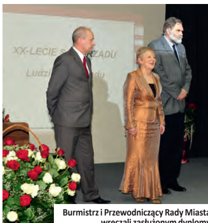
Burmistrz i Przewodniczący Rady Miasta wręczali zasłużonym dyplomy