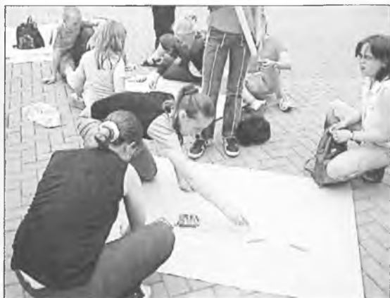
W Klęce uczniowie malowali most przyjaźni

Dzień Dziecka w Klęce zbiegł się z wizytą grupą uczniów z Niemiec. W uroczystościach wzięli udział uczniowie z Klęki i Lonnerstadt. Uczennice klasy pierwszej przedstawiły