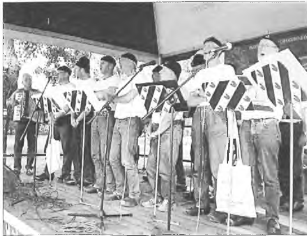
Holenderska grupa śpiewała szanty m.in. w Chociczy