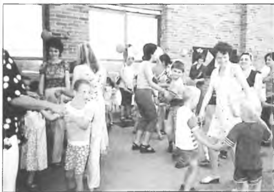
W Kolniczkach bawili się również rodzice