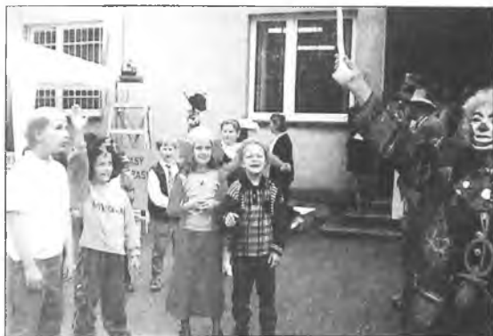
Szkoła w Boguszynie odwiedziła dwóch kłownów

konkursy dla całej rodziny, słodycze i napoje przygotowane przez rodziców. Rada Rodziców przekazała pieni-