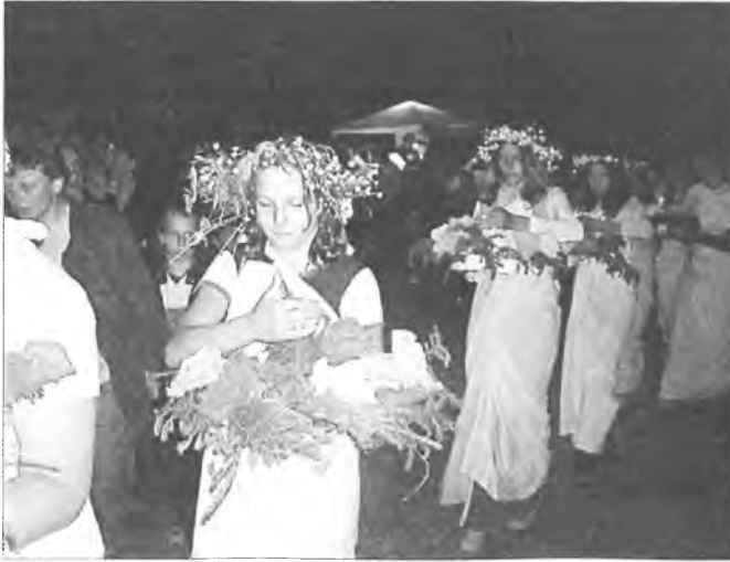
Mimo niesprzyjającej pogody wianki jak co roku puszczono na wodę