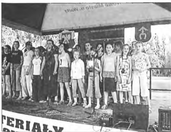
Na scenie wystąpili uczniowie szkoły w Chociczy

Organizatorzy serdecznie dziękują wszystkim sponsorom, bez których festyn w Chociczy nie mógłby się odbyć.