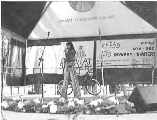
Na nowomiejskiej scenie zaśpiewali laureaci „Idola”