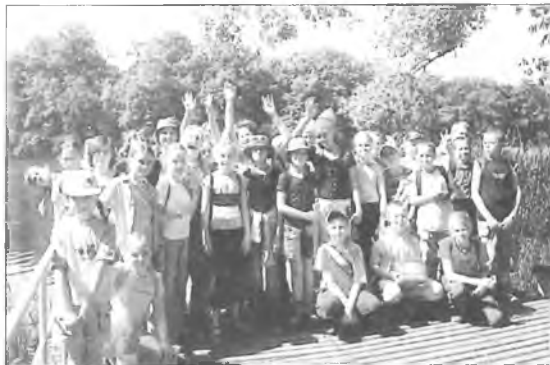
Dzieci z Chociczy nad jeziorem w Zaniemyślu

W szkole podstawowej w Kolniczkach Dzień Dziecka połączono z obchodami święta mamy i taty. W rodzinnej atmosferze dzieci z oddziałów zerowych zaprezentowały program artystyczny adresowany głównie do rodziców. Przybyli goście, od swoich pociech, otrzymali własnoręcznie wykonane upominki, po czym zaproszeni zostali do rodzinnego tańca. Piękna słoneczna pogoda pozwoliła na piknikowanie na trawie. Były