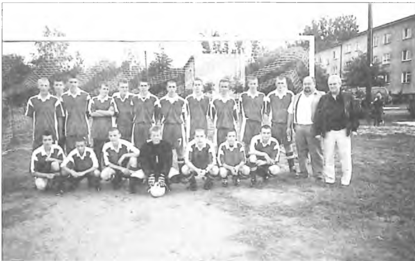
na zdjęciu drużyna UKS Chocicza

Drużyna Nowego Miasta jest jednak niekwestionowanym liderem ligi. Wielkopolska Korporacja na dziesięć spotkań tylko jedno przegrała (z Sokółem Boguszyń) i jedno zremisowała. Warto też zaznaczyć, że mistrz jesieni stracił tylko trzy bramki. W walce o mistrzostwo nie zabraknie z pewnością drużyny LZS Szyplów, która ma tylko punkt straty do lidera. Po dwadzieścia punktów mają na swoim koncie Sokół Boguszyń i Old Boys. Broniąca tytułu drużyna Sadelka Chromiec jest na piątym miejscu w tabeli z dorobkiem osiemnastu punktów. Dobrą grą w rundzie jesiennej może także pochwalić się Wolica Pusta. Szkoda, że rozgryw-