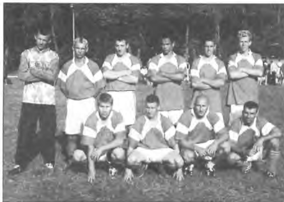
Zwycięzcy turnieju - Sokół Boguszyn

cicza. W grupie II rywalizowały LZS Boguszynek, MKS Chocicza i Old Boys Boguszyn. Po rozgrywkach grupowych, automatycznie siódma lokata przypadła zespołowi Drink Team. W meczu o szóste miejsce Sokół