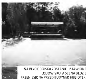
NA PLYCIE BOISKA ZOSTANIE USTAWIONE LODOWISKO, A SCENA BĘDZIE PRZEMIESIONA PRZED BUDYNEK BIBLIOTEKI

W tej sytuacji Burmistrz zaproponowała krótki plan rozwiązania istniejącego problemu. Zaapelowała, by przerwać nie dające rozwiązania dyskusje i postawić w krótkim czasie na terenie byłego MOSiR-u tymczasowy pawilon, stanowiący zaplecze organizacyjne dla wszystkich obiektów