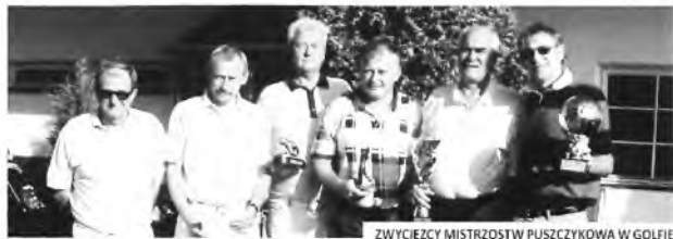
ZWYCIĘZY MISTRZOSTW PUSZCZYKOWA W GOLFIE

przez prezesa i kapitana puszczykowskiego klubu golfowego. Na kolejne rozgrywki golfiści z Puszczykowa muszą poczekać do wiosny. | AGNIESZKA BARTKOWIAK