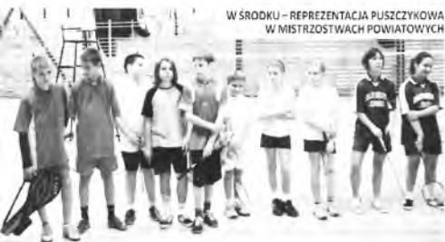
W ŚRODKU – REPREZENTACJA PUSZCZYKOWA W MISTRZOSTWACH POWIATOWYCH