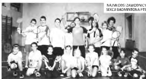
NAJMLODSI ZAWODNICY SEKCJI BADMINTONA PPS