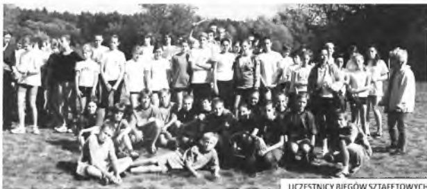
UCZESTNICY BIEGÓW SZTAFETOWYCH